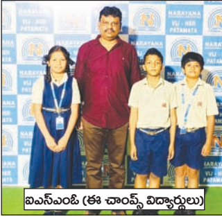
ఐఎస్ఎంఓ (ఈ చాంప్స్ విద్యార్థులు)