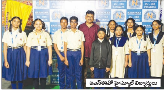
ఐఎస్ఈవో హైస్కూల్ విద్యార్థులు

విజయవాడ, మేజర్ స్కూల్స్ : సినాప్ప ఒలింపియాడ్ పోటీ పరీక్షలలో హై స్కూల్ రోడ్ లోని పటమట నారాయణ ఈ.ఎం. స్కూల్ విద్యార్థులు అత్యుత్తమ ర్యాంక్ లు సాధించారు. ఆల్ ఇండియా లెవెల్ లో జరిగిన ఈ పోటీలకు నారాయణ ఈ చాంప్స్, హైస్కూల్ నుంచి విద్యార్థులు పాల్గొన్నారు. పోటీల్లో పాల్గొనడమే కాకుండా అత్యుత్తమ ర్యాంకులు సాధించడం పట్ల