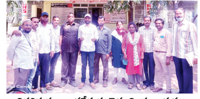
వినతిప్రతం అందచేస్తున్న వైద్య మిత్ర నాయకులు