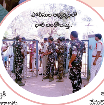
పోలీసుల అధ్యక్షులతో భారీ బందోబస్తు..