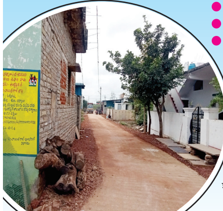
ఓర్వకల్లు మండల కేంద్రంలో నిర్మించిన సిసిరోడ్డు