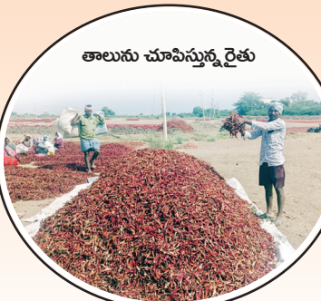
తాలును చూపిస్తున్న రైతు