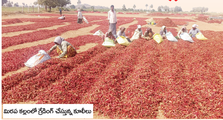
మిరప కల్లలో గ్రేడింగ్ చేస్తున్న కూలీలు