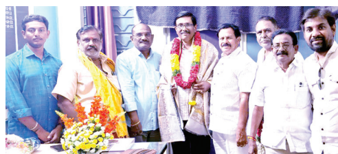
డిప్యూటీ డీఈవోను నన్యూనిస్తున్న ప్రైవేటు స్కూల్ కరస్పాండెంట్లు