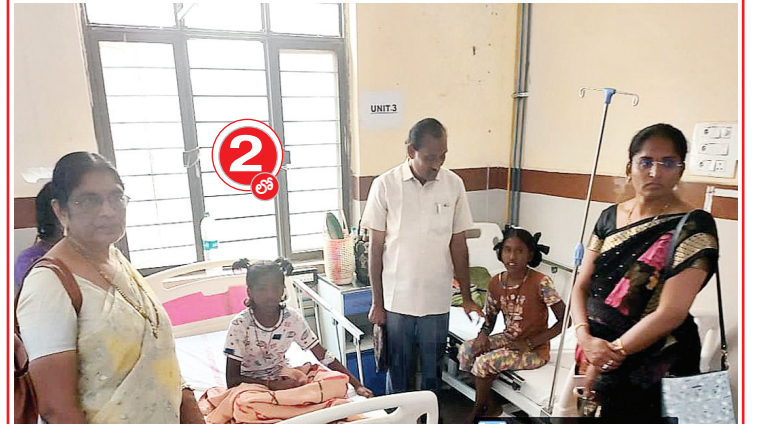
ఆసుపత్రిలో విద్యార్థులను పరామర్శిస్తున్న అధికారులు