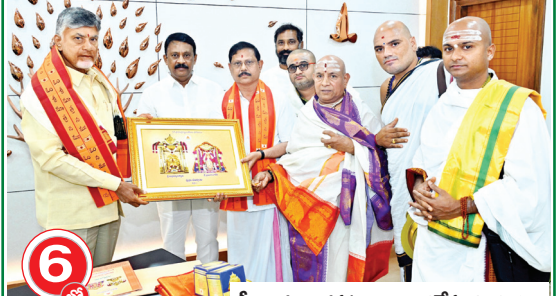
సీఎంకు చిత్రపటాన్ని అందజేస్తున్న దృశ్యం