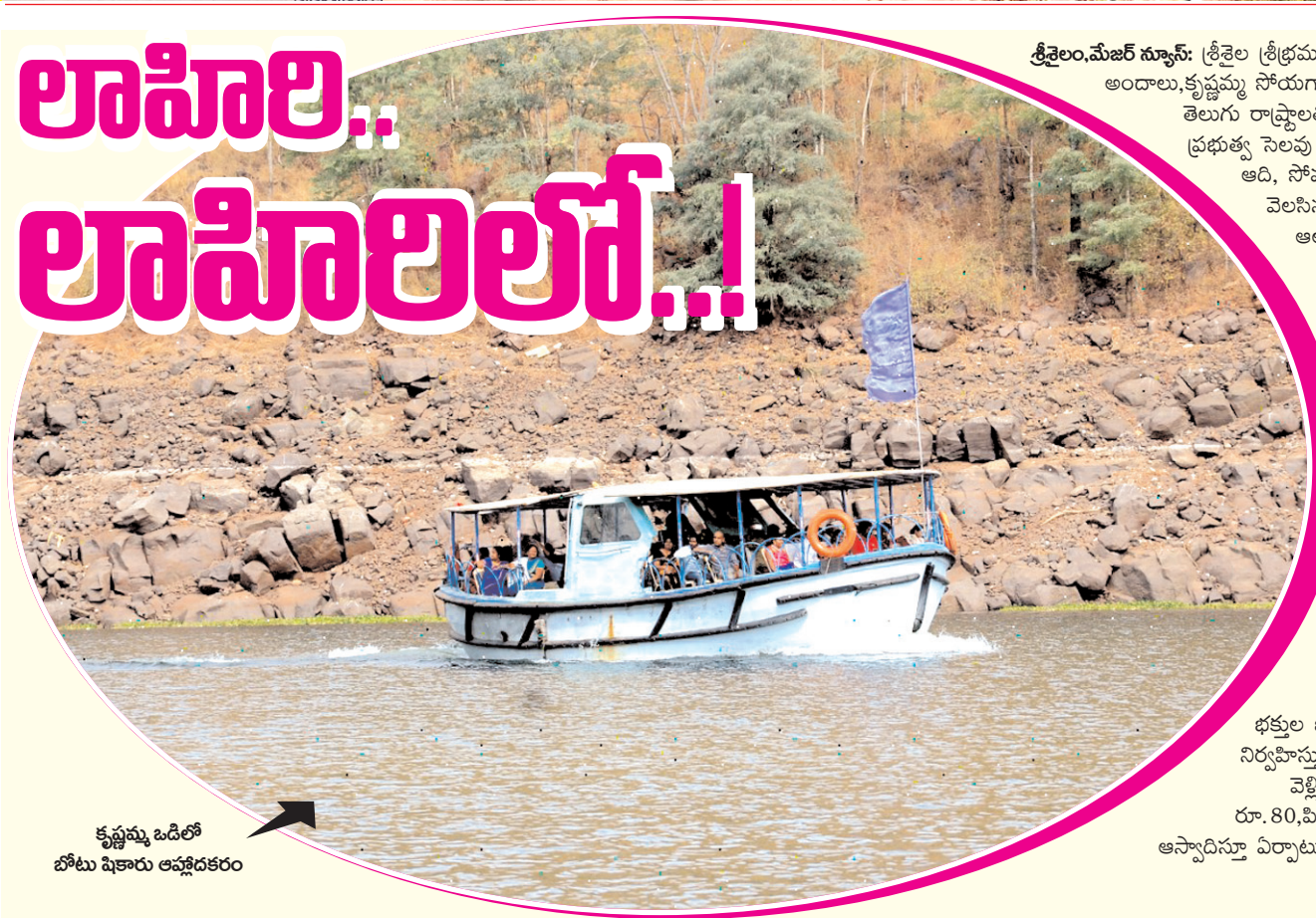
కృష్ణమ్మ ఒడిలో బోటు షికారు ఆహ్లాదకరం