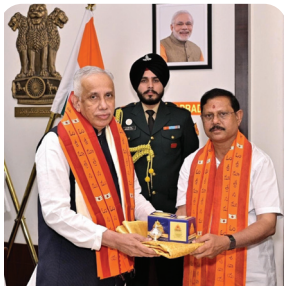
రాష్ట్ర గవర్నర్కు లాస్య ప్రసాదాలను అందజేస్తున్న ఈరోజు

శ్రీశైలం, మేజర్ న్యూస్: శ్రీశైల క్షేత్రంలో ఈనెల 19 నుండి మార్చి 1 వ తేదీ వరకు మహాశివరాత్రి బ్రహ్మాత్మ వాలు అత్యంత వైభవంగా జరగనున్నాయి. ఈ ఉత్సవా లకు పలువురు ప్రముఖు లను ఆహ్వానించడం జరు గుతోంది. ఈ సందర్భంగా సోమవారం మిగతా రిపోర్ట్