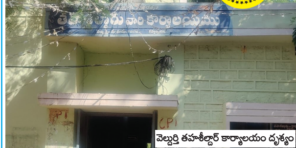
వెల్దుర్తి తహశీల్దార్ కార్యాలయం దృశ్యం