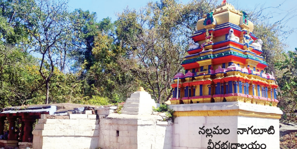
నల్లమల నాగలూటి వీరభద్రాలయం