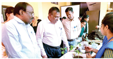
పరిశోధనలను పరిశీలిస్తున్న ఉప కులపతి, రిజిస్ట్రార్