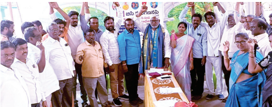
సంఘీభావం తెలుపుతున్న బిసి సంఘాల నేతలు