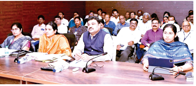
వీడియో కాన్ఫరెన్స్లో పాల్గొన్న కలెక్టర్, అధికారులు

కర్నూలు, మేజర్ న్యూస్ ప్రతినిధి : ఈ నెల 20వ తేదీ నుండి మార్చి 2వ తేదీ వరకు చేపడుతున్న పి4 సర్వేను విజయవంతంగా నిర్వహించాలని జిల్లా కలెక్టర్ పి రంజిత్ భాషా అధికారులను ఆదేశించారు. గురువారం రాష్ట్ర సచివాలయం నుండి ప్రభుత్వ ప్రధాన కార్యదర్శి కె విజయానంద్ ఆయా శాఖల ప్రిన్సిపల్ సెక్రటరీలు, డైరెక్టర్లు ఉన్నతాధికారులతో కలిసి పి4 సర్వే, ఎంఎస్ఎంఈ సర్వే, ఇంటర్మీడియట్, గ్రూప్-2 పరీక్షల నిర్వహణపై వీడియో కాన్ఫరెన్స్ ద్వారా సమీక్ష నిర్వహించి పలు సూచనలు చేశారు. ఈ వీడియో కాన్ఫరెన్స్ అనంతరం జిల్లా కలెక్టర్ అధికారులతో మాట్లాడుతూ జిల్లాలో పబ్లిక్ ప్రైవేట్ సీపుల్ పార్ట్నర్షిప్ సర్వే ద్వారా 20శాతం అత్యంత పేదరికం కలిగిన వాళ్లను గుర్తించడం జరుగుతుందని మొదటి దశలో సర్వే జరుగుతున్న జిల్లాలో కర్నూలు జిల్లా ఒకటిని పేర్కొన్నారు. ఈ నెల 18వ తేదీన జడిపి సిఈఓ, ఎంపిడిఓలు, డిఎల్ఓలు, 19వ తేదీ మండల స్థాయిలో గ్రామ, వార్డు సచివాలయ సిబ్బందికి ఈ అంశంపై శిక్షణ నిర్వహించడం జరిగిందన్నారు. ముఖ్యమంత్రి ప్రతిష్టాత్మకంగా చేపడుతున్న ఈ కార్యక్రమాన్ని విజయవంతంగా నిర్వహించాలని ఆదేశించారు. అలాగే ఏపీపిఎస్ఎస్ అధ్యక్షులలో నిర్వహించున్న గ్రూప్-2పరీక్షలు, ఇంటర్ పరీక్షల కోసం పకడ్బందీగా ఏర్పాట్లు చేయాలని ఆదేశించారు. పరీక్షలకు