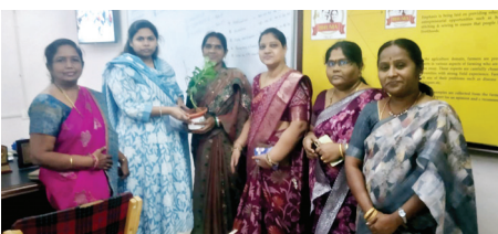
ఎమ్మెల్యేను మర్యాదపూర్వకంగా కలిసిన దృశ్యం

ఆళ్లగడ్డ, మేజర్ న్యూస్ : ఆళ్లగడ్డ ఎమ్మెల్యే భూమా అఖిలప్రియను గురువారం ఇన్నర్ వీల్ క్లబ్ కమిటీ సభ్యులు మర్యాదపూర్వకంగా కలిశారు. ఈనెల 28న ఇన్నర్ వీల్ క్లబ్ ఆధ్వర్యంలో స్థానిక ఎద్దుల పాపమ్మ ప్రభుత్వ ఉన్నత పాఠశాలలో ముందస్తు మహిళా దినోత్సవ వేడుకలను పురస్కరించుకుని వంటల పోటీలకు ముఖ్యఅతిథిగా ఎమ్మెల్యే భూమా అఖిలప్రియను ఇన్నర్ వీల్ సభ్యులు ఆహ్వానించారు.