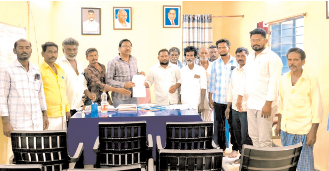
నంద్యాల నూనెపల్లి, మేజర్ న్యూస్: ఆళ్ళగడ్డ నియోజకవర్గం శిరివెళ్ళ మండలం చెన్నూరు గ్రామ పంచాయతీ మజరా గ్రామమైన ఇసుకపల్లిని ప్రత్యేక గ్రామ

పంచాయతీగా గుర్తించాలని డీపీవో జమివుల్లాకు గ్రామ ప్రజలు వినతిపత్రం అందజేశారు. గత కొద్ది నెలల నుంచి గ్రామ ప్రజలు ప్రత్యేక గ్రామ పంచాయతీగా చేయాలని కోరుతూ అధికారులను కలిసి వినతిపత్రం అందజేస్తున్నారు. గ్రామ స్వరాజ్య పాలన తమ గ్రామానికి కల్పించాలని కోరుతూ ఇసుకపల్లి గ్రామ ప్రజలు ప్రత్యేక తీర్మాణం చేసి అధికారులను సంప్రదిస్తున్నారు. గ్రామ పెద్ద పెద్దరిడ్డి విలేకరులతో మాట్లాడుతూ గ్రామంలో 380 రేషన్ కార్డులు, 1500 ఎకరాల రెవెన్యూ భూములు, 1200 మంది జనాభా, 900 మంది ఓటర్లు, 330 మంది జాతీయ గ్రామీణ ఉపాధి హామీ పథకం కూలీలు ఉన్నారు. గ్రామ సభలో వార్డు మెంబర్లు ఏకగ్రీవ తీర్మాణంగా ప్రత్యేక పంచాయతీ ప్రకటించాలని తీర్మాణించారు. పంచాయతీ సెక్రటరీ నుంచి శిరివెళ్ళ ఎంపీడీవో శివమల్లేశ్వర్లకు వినతిపత్రం అందజేసిన విషయం పాఠకులకు విధిపడుతుంది. గురువారం నంద్యాల డీపీవో జమివుల్లాను కలిసి గ్రామం గురించి గ్రామ పెద్దలు వివరించారు. జిల్లా కలెక్టర్ కు ప్రతిపాదనలు పంపి తమ గ్రామమైన ఇసుక పల్లిని ప్రత్యేక గ్రామ పంచాయతీగా గుర్తించాలని కోరారు.