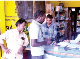
పురుగుల మందు దుకాణాన్ని పరిశీలిస్తున్న ఏవో

మహానంది, మేజర్ న్యూస్ : మహానంది మండలంలోని ఎరువులు, పురుగుల మండల దుకాణాల యజమానులు ప్రభుత్వం నిర్ణయించిన ధరలకే విక్రయాలు జరపాలని, అధిక ధరలకు విక్రయిస్తే శాఖా పరమైన చర్యలు తప్పవని ఏవో నాగేశ్వరరెడ్డి పేర్కొన్నారు. గురువారం మండలంలోని గాజులపల్లి కీర్తి ఫర్టిలైజర్స్ షాపును ఆకస్మికంగా తనిఖీ చేయడం జరిగింది. రికార్డులను పరిశీలించారు. అనంతరం ఆయన మాట్లాడుతూ డీలర్లు ఎరువుల నియంత్రణ చట్టం ప్రకారమే వ్యాపారం చేయాలని, యూరియాను గరిష్ట చిల్లర ధరలు మాత్రమే విక్రయించాలని, అధిక ధరలకు విక్రయించినట్లు ఫిర్యాదులు వస్తే శాఖా పరమైన చర్యలు తప్పవని హెచ్చరించారు. ప్రతి రైతులకు తప్పని సరిగా బిల్లులు అందజేయాలని అన్నారు. స్టాక్ రిజిస్టర్లు తప్పని సరిగా మెంటనెన్స్ చేయాలని అన్నారు. ప్రతి రోజు ఎరువుల ధరలను బోర్డుపై రాసి రైతులకు కనిపించే విధంగా బోర్డులు పెట్టాలని అన్నారు.