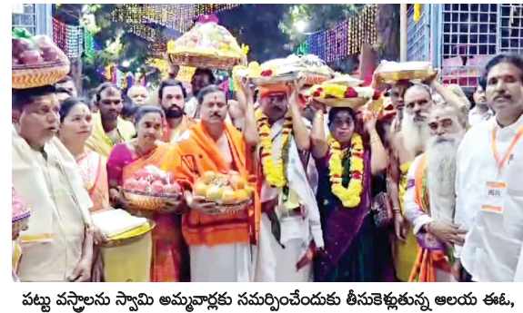
పట్టు వస్త్రాలను స్వామి అమ్మవార్లకు సమర్పించేందుకు తీసుకెళ్లుతున్న ఆలయ ఈడి,