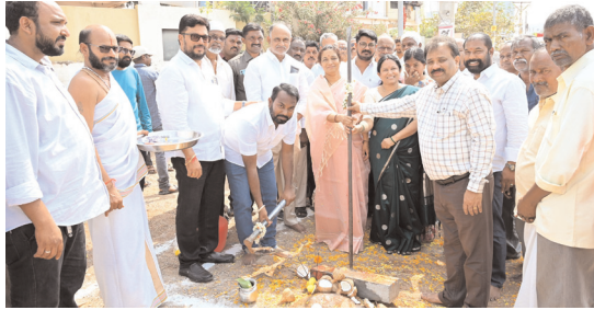
పనులకు భూమిపూజ చేస్తున్న ఎమ్మెల్యే, కమీషనర్

కర్నూలు నగరం, మేజర్ న్యూస్ : నగరంలో నూతనంగా ఏర్పడిన కాలనీల్లో మౌలిక వసతుల కల్పనకు ప్రత్యేక ప్రాధాన్యత ఇస్తున్నట్లు పాణ్యం ఎమ్మెల్యే గౌరు చరితరెడ్డి, నగరపాలక కమీషనర్ రవీంద్ర బాబులు అన్నారు. గురువారం 35వ వార్డు చింతలముని నగర్ నందు రూ. 8లక్షలతో, 41వ వార్డు టీజీబీ కాలనీలో రూ. 9.50లక్షలతో, 36వ వార్డు ఎన్ఎల్వి నిలయం, వానవి నగర్ ప్రాంతాల్లో రూ. 9.90 లక్షలతో డబ్బూబియం రహదారుల నిర్మాణానికి ఎమ్మెల్యే, కమీషనర్లు భూమి పూజ చేశారు. ఈ సందర్భంగా ఎమ్మెల్యే మాట్లాడుతూ నగరం రోజురోజుకు విస్తరిస్తుందని నూతన కాలనీల్లో అధ్యాత్మంగా ఉన్న రహదారులపై వెంటనే రహదారుల నిర్మాణానికి చర్యలు తీసుకుంటా మన్నారు. కమీషన్ మాట్లాడుతూ నగరంలో మౌలిక సదుపాయాల