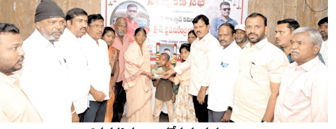
ఆర్థిక సహాయం అందజేస్తున్న దృశ్యం