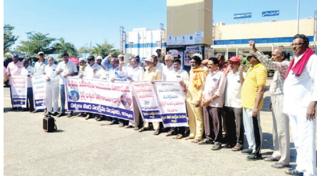
ధర్నా నిర్వహిస్తున్న పెన్షనర్స్, విలేజర్లు, కళాకారులు