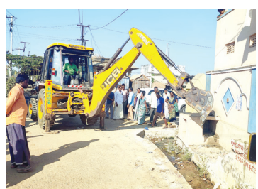
అక్రమణలు తొలగిస్తున్న దృశ్యం

బండి ఆత్మకూరు రూరల్, మేజర్ న్యూస్ : మండల కేంద్రంలోని భాస్కర్ రెడ్డి ఇంటి నుండి సంత గేటు వరకు నూతన రోడ్డు నిర్మాణం కోసం అక్రమ కట్టడాల కూల్చివేత పనులు సోమవారం ప్రారంభమయ్యాయి. నియోజకవర్గ ఎమ్మెల్యే బుడ్డా రాజశేఖర్ రెడ్డి ప్రత్యేక చొరవతో గత కొన్నేళ్లుగా ప్రధాన సమస్యగా ఉన్న రహదారి నిర్మాణంపై స్థానిక ప్రజలతో మాట్లాడి రోడ్డు నిర్మాణానికి ప్రజలను ఏకం చేశారు. వారీకి ఇబ్బంది కలిగించకుండా గత శనివారం రోడ్డు నిర్మాణ పనులు సాగించాలని అధికారులకు సూచించారు. ఇందులో భాగంగా సోమవారం మధ్యాహ్నం పంచాయతీ కార్యదర్శి అక్బర్ ఆధ్వర్యంలో అక్రమణ నిర్మాణాలు కూల్చివేతలు చేపట్టారు. స్థానిక మండల ఎంపీడివో