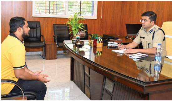
ప్రజా సమస్యలు తెలుసుకుంటున్న ఎస్సీ విక్రమ్ పాటిల్

కర్నూలు క్రైం,మేజర్ న్యూస్ : ప్రజా ఫిర్యాదుల పరిష్కార వేదిక ద్వారా స్వీకరించిన ఫిర్యాదులపై త్వరితగతిన స్పందించి పరిష్కరించాలని కర్నూలు జిల్లా ఎస్సీ విక్రమ్ పాటిల్ ఐపిఎస్ పోలీసు అధికారులను ఆదేశించారు. సోమవారం కర్నూలులోని కొత్తపేటలో టుటోన్ పోలీస్ స్టేషన్ పక్కన ఉన్న ఎస్సీ క్యాంపు కార్యాలయంలో జిల్లా ఎస్సీ విక్రమ్ పాటిల్ ప్రజా ఫిర్యాదుల పరిష్కార వేదిక కార్యక్రమం నిర్వహించారు. జిల్లాలోని వివిధ ప్రాంతాల నుండి మిగతా 2లో