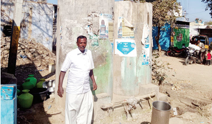
పెద్దకడుబూరులో నిరుపయోగంగా మారిన మినీ నీటి ట్యాంకు