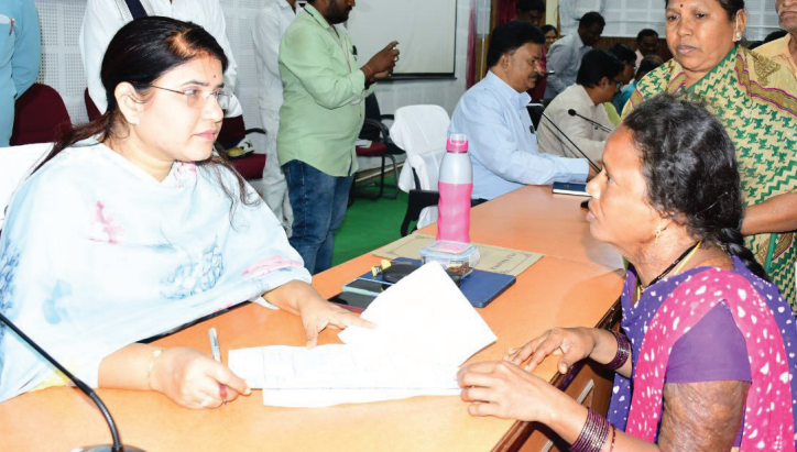
ప్రజా ఫిర్యాదులను స్వీకరిస్తున్న కలెక్టర్ రాజకుమారి