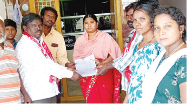
వినతిపత్రం అందచేస్తున్న నాయకులు