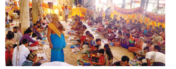
అక్షరాభ్యాసం చేయిస్తున్న భక్తులు