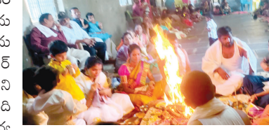
యజ్ఞం చేస్తున్న దంపతులు