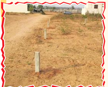
మున్సిపల్ స్థలంలో రాళ్లు పొతి కట్టా చేసుకున్న దృశ్యం.

కల్వకుర్తి మేజర్ న్యూస్ : కల్వకుర్తి మున్సిపాలిటీ పరిధిలోని విద్యానగర్ కాలనీలో సర్వే నెంబర్ 54 /ఎ అఖిల భేగం వెంచర్ లో మున్సిపాలిటీకి చెందిన 1400 గజాల స్థలాన్ని ఓ మాజీ కౌన్సిలర్ భర్త, బిఆర్ఎస్ నేత ఆక్రమించుకున్న విషయం అందరికీ తెలిసిందే.