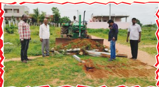
కట్టా చేసిన మున్సిపల్ స్థలంలో రాళ్లు తొలగిస్తున్న మున్సిపల్ అధికారులు ఫైల్ ఫోటో..

ఆక్రమించుకున్న మున్సిపల్ స్థలంపై గతంలో సూర్య దినపత్రికలో వివిధ కథనాలు రావడంతో అప్పట్లో స్పందించిన మున్సిపల్ కమిషనర్, టౌన్ ప్లానింగ్ అధికారి, సిబ్బందితో కలిసి రాళ్లను తొలగించిన విషయం విధితమే.