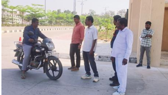
సిబ్బందితో కలిసి అవగాహన కల్పించారు. ఈ సందర్భంగా కలెక్టర్