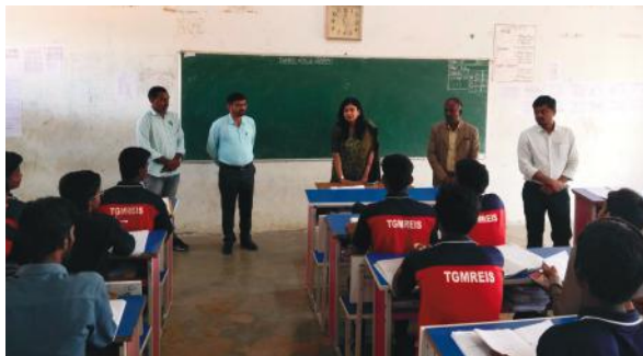
పాఠశాలలో కామన్ డైట్ మెనూ పాటించాలని తప్పకుండా పాటించాలని