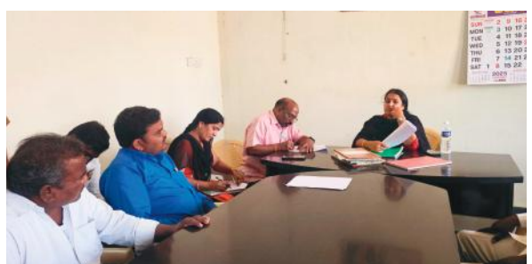
స్థితిగతులను పై అధికారికి తెలియజేస్తామన్నారు. ఈ తనిఖీలలో ఎంపీ ఓ, గ్రామ ప్రజలు ఉన్నారు.

కొండాపూర్ మేజర్ న్యూస్: ప్రభుత్వం ప్రతిష్టాత్మకంగా చేపట్టిన పథకాలు అర్జులైన లబ్ధిదారులకు చెందడం లేదని అందుకు పంచాయతీ కార్యదర్శి నిర్లక్ష్యమేనని వివిధ చక్రికలలో వచ్చిన కథనాను స్పందిస్తూ.. శనివారం డి ఎల్ పి ఓ గ్రామంలో తనిఖీలు నిర్వహించారు. తనిఖీలలో భాగంగా గతంలో జరిగిన ఇందిరమ్మ ఇల్లు సర్వే పంచాయతీ కార్యదర్శి చేశారా! అని ప్రజలను అడగగా.. లేదని ప్రైవేట్ వ్యక్తులు వచ్చారని పంచాయతీ కార్యదర్శి రాలేదని,ఇంటి నిర్మాణ పర్మిట్స్ కొరకు తప్పనిసరిగా రు. 15000/- అడుగుతున్నారని అధికారితో ప్రజలు అన్నారు. పంచాయతీ రికార్డులను అడుగగా.. కనీసం రిజిస్టర్లు పెట్టకపోవడం గమనార్వం. అనంతరం డి ఎల్ పి ఓ అనిత మాట్లాడుతూ.. గ్రామపంచాయతీ పట్ల ఎటువంటి సమస్యలు ఉన్న లిఖితపూర్వకంగా రాసి ఇవ్వాలని కోరారు. గ్రామంలో జరిగిన