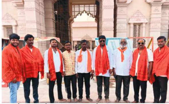
రాయ్కోడ్, సూర్య మేజర్ న్యూస్ : కుంభమేళాకు వచ్చిన ప్రజలు, అయోధ్య బాలరాముడి ముద్దడినా సౌభాగ్య నగరి అయోధ్య దర్శనానికి పెద్దసంఖ్యలో