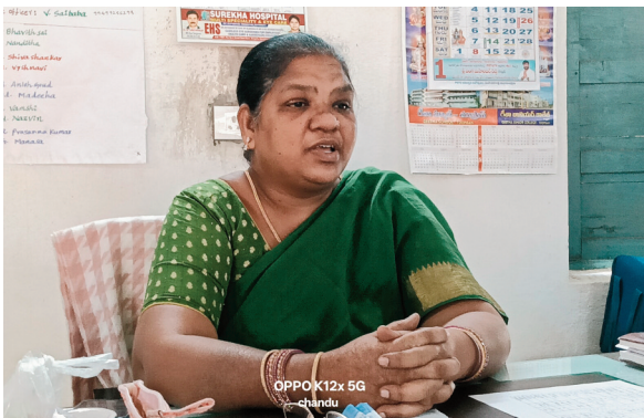
ఉండడంతో విద్యార్థులకు సబ్జెక్టు పరంగా ఇబ్బందులు గురవుతున్నారని త్వరలోనే తాత్కాలిక ఉపాధ్యాయుడిని నియమించాలని కోరారు. ఇకనైనా పాఠశాలపై ఆరోపణలు చేయకుండా పిల్లల భవిష్యత్తును కాపాడాలని కోరారు.