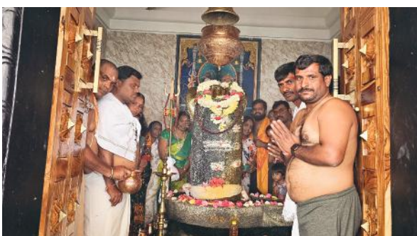
పెద్ద శంకరంపేట్. మేజర్ న్యూస్: మహాశివరాత్రి పర్వదినం పురస్కరించుకొని పెద్ద శంకరంపేట మండల పరిధిలోని కొప్పల్ ఉమా