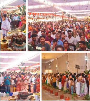
తీర్ణప్రసాదం పంపిణీ చేశారు. మహాశివరాత్రి సందర్భంగా కోటి రుద్రాక్ష శివలింగాన్ని దర్శించుకుంటే అపారమైన పుణ్యం లభిస్తుందని పండితులు తెలిపారు.

అన్నదానం కార్యక్రమం నిర్వహించగా, వందలాది మంది భక్తులు ప్రసాదాన్ని స్వీకరించారు. విద్యాపీఠంలో బారులు తీరిన భక్తులు మహాశివరాత్రి పర్వదినాన్ని పురస్కరించుకుని సంగారెడ్డి మండలం ఫసల్వాడి శివాలయంలో శ్రీ జ్యోతిర్వాస్తు విద్యాపీఠంలో భక్తుల రద్దీ ఊహించని స్థాయికి చేరింది. కోటి రుద్రాక్షలతో తయారు చేసిన విశిష్ట శివలింగానికి అభిషేకం చేసేందుకు భక్తులు భారీ సంఖ్యలో తరలివచ్చారు. ఉదయం నుంచే వేలాది మంది భక్తులు విద్యాపీఠం వద్ద బారులు తీరారు. ప్రత్యేక పూజలు, అభిషేకాలు నిర్వహించేందుకు రెండు గంటలకు పైగా సమయం పడుతుందని విద్యాపీఠం సభ్యులు తెలిపారు. భక్తుల కోసం ప్రత్యేక ఏర్పాట్లు చేసినప్పటికీ, విపరీతమైన రద్దీ కారణంగా ఆలయ పరిసరాలు కిక్కిరిసిపోయాయి. ఈ సందర్భంగా విద్యాపీఠం ఆధ్వర్యంలో భక్తులకు