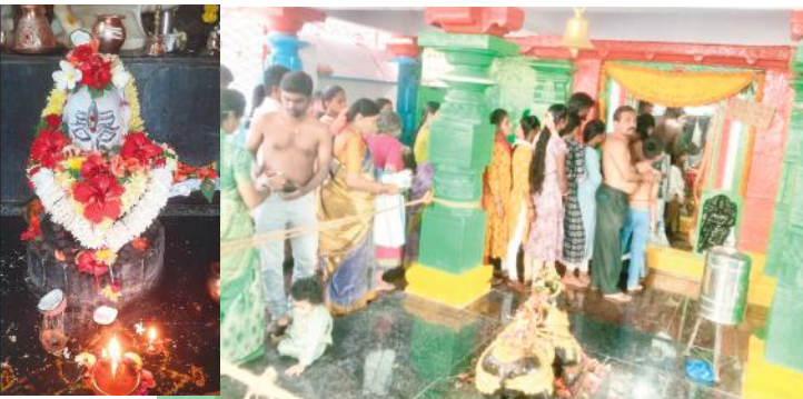
వెళ్లి అభిషేకం నిర్వహించి, ఉపవాస దీక్ష లు విరమించారు.

రామాయంపేట మేజర్ న్యూస్ : బుధవారం నాడు మహాశివరాత్రి పర్వదినం సందర్భంగా రామాయంపేట మండలంలో ఉన్న శైవ క్షేత్రాలు భక్తులతో పోటెత్తాయి. ఉ దయం తెల్లవారుజాము నుంచి భక్తులు శివాలయానికి వెళ్లి- భక్తి శ్రద్ధలతో శివునికి అభిషేకాలను నిర్వహించారు. హార హార మహాదేవ.. శంభో శంకర.. అంటూ భక్తులు చేసిన నినాదాలతో దేవాలయాలు మారుమోగిపోయాయి. రామాయంపేట మండలం లోని అన్ని గ్రామాల్లో ఉన్న శివాలయాల్లోకి భక్తులు, ప్రజలు వెళ్లి ప్రత్యేక పూజలు చేశారు. రామాయంపేట పట్టణంలో ఉన్న శ్రీ రాజరాజేశ్వర దేవాలయం, (సీతయ్య గుడి) నగరేశ్వర దేవాలయం, అయ్యప్ప స్వామి దేవాలయం, శాంతమ్మ గుడి, ఇంకా పలు దేవాలయాలకు భక్తులు