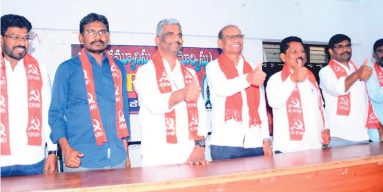
విభజన చట్టాల అమలులో బీజేపీ ప్రజా ప్రతినిధుల వైఫల్యం