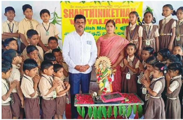
అని నా నూడి ఉంది నిజానికి మనము ఎంత డబ్బు సంపాదించినా అది ఎప్పుడు మన దగ్గర ఉంటుందో లేదో తెలియదు కానీ సరస్వతి మాత్రం జీవితాంతం మనతోనే ఉంటుంది అన్న విషయాన్ని విద్యార్థులకు మరొకసారి గుర్తు చేస్తున్నానని అన్నారు. ఈ కార్యక్రమంలో పాఠశాల ఉపాధ్యాయులు, విద్యార్థులు పాల్గొన్నారు.