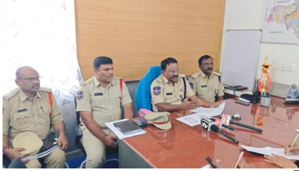
పై మగ, ఆడ మనిషి వెళ్తుండగా, వెనుకల కూర్చున్న ఆడ మనిషిని సుల్తాన్ పూర్ అడ్రస్ అడుగు నెపంతో ఆమె మెడలోని 3 తులాల బంగారు పుస్తల తాడుని లాక్కొని పారిపోయినారు,

తేదీ 04.01.2025 నాడు అందజ సాయంత్రం 05:30 గంటల సమయంలో హవేలి ఘనపూర్ మండలం లోని బూర్గుపల్లి శివారు లో ఒక డి వీ ఎస్ ఎక్సెల్