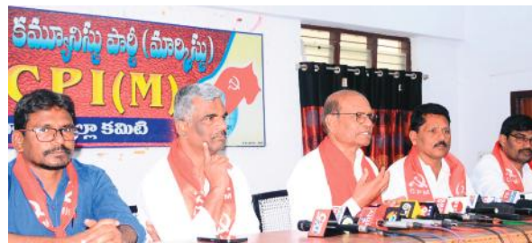
ఆరు గ్యారంటీల అమలు కోసం పోరాటం

విమర్శించారు కాంగ్రెస్ బీజేపీలో పరస్పరం రాజకీయ విమర్శలకే పరిమితమై ప్రజల్ని తప్పుదోవ పట్టిస్తున్నాయని అన్నారు.