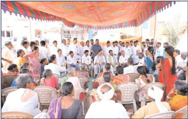
భూదాన్ పోచంపల్లి, మేజర్ న్యూస్ : రాష్ట్ర అభివృద్ధి, ప్రజల సంక్షేమమే కాంగ్రెస్ ప్రభుత్వ ధ్యేయం అని, రాష్ట్ర ప్రభుత్వం పేద ప్రజల కోసం చేపడుతున్న సంక్షేమ

-ప్రతిపక్ష నాయకుల మాటలు ప్రజలు నమ్మొద్దు