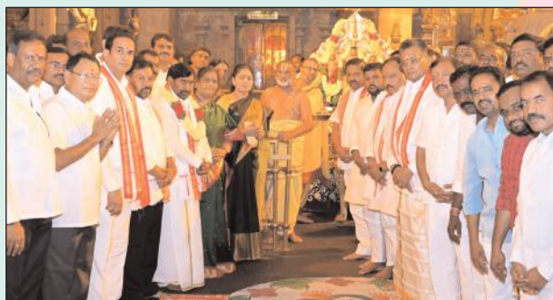
యాదగిరిగుట్ట : తెలంగాణ జాతిపిత మాజీ సీఎం కేసీఆర్ పాలనను ప్రజలు మట్టి

కోరుకుంటున్నారని ఆయన తిరిగి అధికారంలోకి వస్తేనే తమ బతుకులు బాగుపడతాయని ప్రజలు బలంగా కోరుతున్నారని మాజీ డిసిసిబి చైర్మన్ గోంగిడి మహేందర్ రెడ్డి అన్నారు. సోమవారం యాదగిరిగుట్టలో మాజీ సీఎం కేసీఆర్ జన్మదిన వేడుకల్లో పాల్గొని ఆయన కేట్ కట్ చేసి అభిమానులు బీహార్ సీఎం కార్యకర్తలకు స్వీట్లు పంచివేసి చేశారు ఈ సందర్భంగా ఆయన మాట్లాడుతూ కాంగ్రెస్ ప్రభుత్వ పాలనలో ప్రజలు అనేక కష్టాలు పడుతున్నారని అన్నారం ఇంతవరకు రైతుబంధు లేదని కొంతమందికే రుణమాఫీ చేసి అందరికీ చేశామని కాంగ్రెస్ నేతలు హామీ మాటలు చెబుతూ మోసం చేస్తున్నారని విమర్శించారు. ఇచ్చిన హామీలను నిలబెట్టుకోలేని కాంగ్రెస్ ప్రభుత్వాన్ని ప్రజలు చీకాడుతున్నారని అన్నారు. మట్టి తిరిగి బిఆర్ఎస్ అధికారంలోకి రావాలని సీఎం కేసీఆర్ రావాలని ప్రజలు కోరుతున్నారని అన్నారు. గత బిఆర్ఎస్ ప్రభుత్వ పాలనలో ప్రజలు అన్ని రకాల ప్రభుత్వ పథకాలను పొందాలని పెద్ద ఎత్తున అభివృద్ధి సంక్షేమ కార్యక్రమాలు జరిగాయని అన్నారు కాంగ్రెస్ ప్రభుత్వం ఏ పథకాన్ని అమలు చేయలేక ఇచ్చిన హామీలు నిలబెట్టుకోలేక పూర్తిగా విఫలమైందని అన్నారు. కాంగ్రెస్ వైఖళ్ళు పై తమ పోరాటం ఉద్యతం చేస్తామన్నారు. ప్రజలు అన్ని గమనిస్తున్నారని కాంగ్రెస్ మోసా లై ప్రజలే తిరగబడి రోజు దగ్గరలో ఉందని అన్నారు. ఈ సందర్భంగా ఆయన నాయకులు అభిమానులు కార్యకర్తల కలిసి వైకొంఠ ద్వారం సుడి బస్టాండ్ వరకు ర్యాలీ నిర్వహించి మాజీ సీఎం కేసీఆర్ పాలనపై బిఆర్ఎస్ పార్టీ కార్యకర్తలతో కలిసి సృత్యం చేసి సంబరాలు చేసుకున్నారు. కార్యక్రమంలో నాయకులు, కార్యకర్తలు పెద్ద ఎత్తున పాల్గొన్నారు.