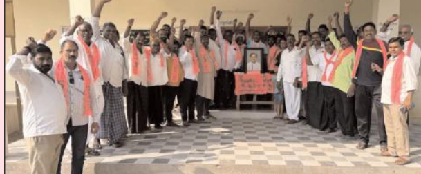
చిలుకూరు : చిలుకూరు మండలంలోని శాఖా గ్రంథాలయంలో తెలంగాణ రాష్ట్ర