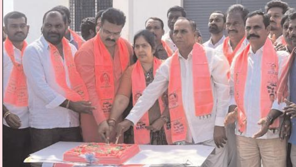
తుంగతుర్తి : భారత రాష్ట్ర సమితి అధ్యక్షులు, మాజీ ముఖ్యమంత్రి, కల్వకుంట్ల