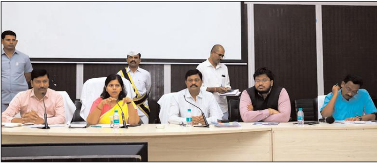
ఉమ్మడి నల్గొండ జిల్లా ట్యూబ్