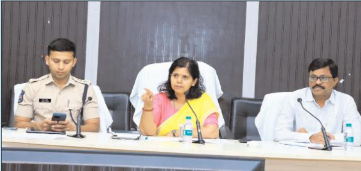
ఉమ్మడి నల్గొండ జిల్లా ట్యూబ్

ఇసుక అక్రమ రవాణాను అరికట్టడంలో భాగంగా నిఘాను, తనిఖీలను తీవ్రతరం చేయాలని జిల్లా కలెక్టర్ ఇలా త్రిపాలి ఆదేశించారు. ఇసుక అక్రమ రవాణాను అరికట్టే విషయమై గురువారం ఆమె జిల్లా ఎస్పీ శరత్ చంద్ర ప్రవార్తో కలిసి తహసీల్దారులు, ఎంపీడీవోలు, మైనింగ్, ఇరిగేషన్, పోలీస్ అధికారులతో ఉదయాదిత్య భవన్లో సమావేశం నిర్వహించారు. ప్రభుత్వం ద్వారా ఆయా ఇసుక రీచ్లలో అనుమతించిన వాహనాలు, అనుమతించిన వారికి మాత్రమే ఇసుకను తీసుకువెళ్లే అధికారం ఉందని, అలా కాకుండా ఎవరైనా అక్రమంగా ఇసుకను రవాణా చేస్తే కఠిన చర్యలు తీసుకోవాలని చెప్పారు. ఇందుకు ఇసుక రీచ్ల వద్ద నైట్ విజన్ కెమెరాలతో పాటు, హైరెజల్యూషన్ సీసీ కెమెరాలు ఏర్పాటు