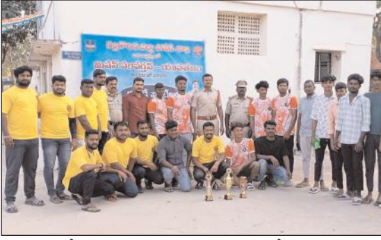
చందూరు, మేజర్ న్యూస్ : యువత చెడు మార్గంలో వెళ్లకుండా సరైన సిబ్బంది పాల్గొనడం జరిగింది.