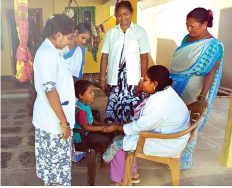
చిన్నారులను పరిశీలిస్తున్న సీనియర్ సివిల్ జడ్జి బి.గాయత్రి

అత్తూకూరు, మేజర్ న్యూస్ : ఇంటింటా న్యాయప్రచార కార్యక్రమం నిర్వహించి 18 సంవత్సరాలలో వయసున్న వారిలో ఎదుగుదల తక్కువగా ఉన్నవారిని గుర్తించి ఆ జాబితాలను పంపడం ద్వారా తగు సాయమందిస్తామని అత్తూకూరు సీనియర్ సివిల్ జడ్జి, మండల న్యాయసేవా అధికార సంఘం కార్యదర్శి బి.గాయత్రి పేర్కొన్నారు. మంగళవారం ఆమె పలువురు కమిటీ సభ్యులతో కలిసి అత్తూకూరు పట్టణంలోని 80కుటుంబాల్లో పర్యటించి పరిశీలించి 20మంది ఎదుగుదలలోపాలున్న వారిని గుర్తించారు. డిల్లీకి చెందిన జాతీయన్యాయ సేవా అధికార సంస్థ, అమరావతిలోని రాష్ట్ర న్యాయసేవా అధికారసంస్థ ఆదేశాలమేరకు జిల్లా ప్రధానన్యాయమూర్తి, జిల్లా న్యాయసేవా అధికారసంస్థ చైర్మన్ సి.యామిని సూచనలతో అత్తూకూరులో న్యాయమూర్తి గాయత్రి ఆధ్వర్యంలో ఇంటింటాన్యాయప్రచారం కార్యక్రమం నిర్వహించారు. ఈసందర్భంగా న్యాయమూర్తి గాయత్రి మాట్లాడుతూ.. జిల్లా వ్యాప్తంగా ఇంటింటాన్యాయప్రచార కార్యక్రమం నిర్వహిస్తున్నామన్నారు. జిల్లాలో 20బృందాలుగా ఏర్పాటు జరిగిందన్నారు. ఒక్కో టీమ్లో ఒక ప్యానల్ న్యాయవాది, ఒక పారాలీగల్ వాలంటీర్, ఒక ఏఎన్ఎం, ఒక అంగన్వాడీ కార్యకర్త, ఒక ఆశాకార్యకర్త, ఒక వైద్యాధికారి, భవిత సెంటర్ నిర్వాహకులు ఉంటూ కార్యక్రమం నిర్వహిస్తారని ఆమె వివరించారు. ఈ అవకాశాన్ని పిల్లల తల్లిదండ్రులు సద్వినియోగం చేసుకోవాలని గాయత్రి కోరారు. గుర్తించబడిన ఎదుగుదల తక్కువగా ఉన్నవారికోసం జాతీయన్యాయసేవా అధికారసంస్థ (నల్సా) బాలల సంరక్షణకోసం స్వేచ్ఛాపూర్వక న్యాయ సేవల పథకం 2024, మానసిక అనారోగ్యం ఉన్నా మేధోచైతన్యాలనువారున్నా చట్టపరమైన సేవలపథకం 2024 పథకాలను