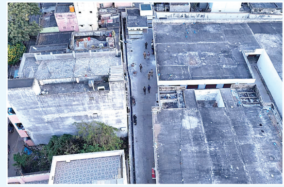
(మొదటి పేజీ తరువాయి)

సీబిలు డ్రాన్ కెమెరాలతో ఎప్పటికప్పుడు నిఘా ఉంటుందన్నారు. శివారు ప్రాంతాలు నిర్మాణవ్యయమైన ప్రదేశాలలో క్షుణ్ణంగా పరిశీలించి అనుమానాస్పదంగా ఉన్న వ్యక్తులను అదుపులోకి తీసుకొని విచారించడం జరుగుతుందన్నారు. అలాగే ఓపెన్ డ్రింకింగ్ పై ఉక్కుపాదం, ఇప్పటికే 48 కేసులు నమోదు చేయడం జరిగిందన్నారు. గంజాయి వినియోగం, పేకాట, ఈవ్ టీజింగ్, చైన్ స్నాచింగ్, రహదారి ప్రమాదాలు, రద్దీ ప్రాంతాలు, ఇతర అసాంఘిక కార్యకలాపాలపై చట్టపరమైన చర్యలు తీసుకుంటామన్నారు.