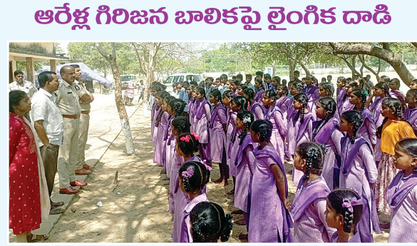
ఆరేళ్ల గిరిజన బాలికపై లైంగిక దాడి

(మొదటి పేజీ తరువాయి) ఘటనపై పూర్తి వివరాలు సేకరిస్తున్నారు. హైస్కూల్ లో ఇలాంటి ఘటనలు ఇకపై జరగకుండా ఉండేందుకు విద్యార్థులకు సైబల్ అవగాహన కార్యక్రమాలు నిర్వహిస్తున్నారు. సమాజంలో ఆందోళన.. ఈ ఘటనపై గ్రామస్థులు, తల్లిదండ్రులు ఆందోళన వ్యక్తం చేస్తున్నారు. చిన్నారుల భద్రతపై మరింత కఠిన చర్యలు తీసుకోవాలని డిమాండ్ చేస్తున్నారు. విద్యార్థులకు కేవలం చదువు మాత్రమే కాకుండా, మంచి నడవడిక, నైతిక విలువలు నేర్పించాల్సిన బాధ్యత ఉపాధ్యాయులపై ఉందని పలువురు అభిప్రాయపడ్డారు. పోలీసుల దర్యాప్తు కొనసాగుతోంది..