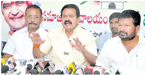
విప్లవకారని, ఆయన పోలీసుల బట్టలు విప్పుతానని వ్యాఖ్యానించడం ఆయన రౌడీయజానికి నిదర్శనమన్నారు.