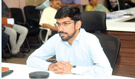
ప్రచారం చేసేవారిపై క్రిమినల్ కేసులు తప్పవని కలెక్టర్ హెచ్చరించారు.