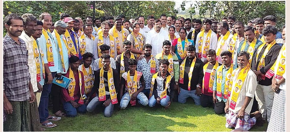
అవుతుండటంపై అభ్యంతరం తెలిపి పేదూరు రైతులకు అండగా నిలిచామన్నారు. ప్రస్తుతం పైపులైను పనులను ఆపడంతో పాటు బాధిత రైతులకు తమిళనాడులో పరిహారం ఇచ్చిన తరహాలోనే ఇక్కడ కూడా ఇవ్వాలని కోరామని తెలియజేశారు. ఈ కార్యక్రమంలో టీడీపీ నాయకులు, కార్యకర్తలు తదితరులు పాల్గొన్నారు.

చేరారు. ఈరోజు పేదూరు ఉప సర్పంచ్ కలిసి 70 కుటుంబాలు చేరి వైసీపీని ఖాళీ చేశారున్నారు. నాకు సొంతూరుతో సమానమైన పేదూరు అభివృద్ధిలో తెలుగుదేశం పార్టీ ప్రత్యేక ముద్ర. గతంలోనే పేదూరు - చింతోపుల మధ్య తారు రోడ్డు నిర్మించామని, ఈ రోడ్డుతో రైతుల రాకపోకలకు మార్గం సుగమం కావడంతోపాటు భూముల విలువ భారీగా పెరిగిందన్నారు. కృష్ణారెడ్డిపాళెం నుంచి మాచర్లవారి పాళెనికి గతంలోనే రోడ్డు మంజూరు చేయగా వైసీపీ ప్రభుత్వంలో పక్కన పెట్టేశారు. ఆ రోడ్డు పనులను కూడా చేపడతామని, పేదూరు పంచాయతీ పరిధిలో రూ.35 లక్షలతో సిమెంట్ రోడ్ నిర్మాణంతో పాటు తాగునీటి పథకాల పనులు చేస్తున్నామని, వరిపొలాల్లో చేపట్టిన బీబీసీఎల్ పైపులైను పనులతో పంట ధ్వంసం