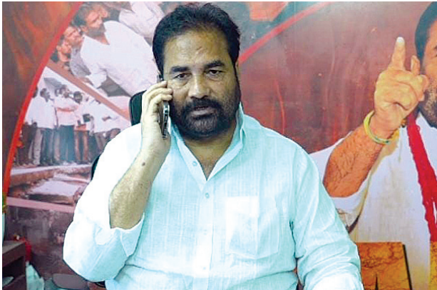
నెల్లూరు కలెక్టరేట్, మేజర్స్ న్యూస్ : మార్చి 2 నుంచి రంజాన్ నెల ప్రారంభమవుతున్న

లైటింగ్ ఏర్పాటుతోపాటు పారిశుధ్యాన్ని మెరుగుపరచండి