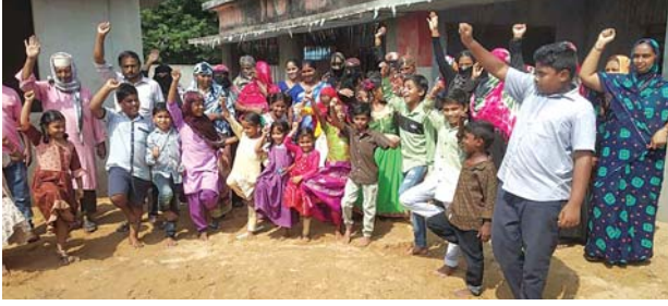
ఆత్మకూరులో విద్యార్థులు, తల్లిదండ్రులు నిరసన తెలుపుతున్న దృశ్యం

మాయం అన్న చందంగా ఉందని పలువురు వ్యాఖ్యానిస్తున్నారు. ప్రభుత్వ తాజా ప్రతిపాదనల ప్రకారం ఆత్మకూరు మండలంలో పరిశీలిస్తే ప్రభుత్వ పరంగా మొత్తం 73 పాఠశాలలున్నాయి. గతంలో 7 క్లస్టర్లు కాగా తాజాగా 3 క్లస్టర్లే ఉంటాయి., దేపూరు, బండూరుపల్లి ప్రాథమికోన్నత పాఠశాలల్లో 6,7 తరగతులను రద్దు చేయనున్నారు. ప్రాథమిక, ప్రాథమికోన్నత పాఠశాలలు 61 కాగా 1,2 తరగతులతో కొనసాగే ఫౌండేషన్ స్కూల్స్ 32 ఉండేలా, మాడల్ స్కూళ్ళు 18, బేసిక్ ప్రైమరీ స్కూళ్ళు 11 ఉండేలా ప్రతిపాదించారు. 32 స్కూళ్ళలోని 3,4,5 తరగతులను ఇతర గ్రామాల పాఠశాలల్లో, పట్టణంలోని ఇతర ప్రాంతాల స్కూళ్ళలో విలీనం చేసేలా ప్రతిపాదించారు. ఈ ప్రతిపాదనలు వెలువడడంతో పలు గ్రామాల్లో, పట్టణంలోని పలువార్డుల్లో పాఠశాల విద్యార్థులు, వారి తల్లిదండ్రులు, పాఠశాల విద్యకమిటీ సభ్యులు తీవ్రంగా ఈ నిర్ణయాలను వ్యతిరేకిస్తే ఆందోళనతో నిరసనకు దిగుతున్నారు. అధికారులకు వినతిపత్రాలు అందజేస్తున్నారు. తమ పాఠశాలలోని 3, 4, 5 తరగతుల విద్యార్థులను ఇతర దూరంగా ఉన్న పాఠశాలల్లో విలీనం చేస్తే అత్యంత ఇబ్బందికరంగా ఉంటుందని చెబుతూ ఈ నిర్ణయం నిలిపివేయాలని కోరుతున్నారు. గురువారం జరిగిన విద్యకమిటీల సమావేశాల్లో కూడా పలువురు ప్రభుత్వ నిర్ణయానికి వ్యతిరేకంగా తీర్మానాలు చేశారని తెలుస్తోంది. ఉపాధ్యాయ సంఘాలవారు కూడా పలువురు ప్రభుత్వ తరగతుల విలీన ప్రతిపాదనలను వ్యతిరేకిస్తున్నారు. ప్రాథమిక పాఠశాలల్లో విద్యను మెరుగుపరచాలని, విద్యార్థులకు నాణ్యమైన విద్య అందించాలని, ఆదర్శంగా తీర్చిదిద్దాలన్న లక్ష్యంగా ఈ మార్పులు అని చెబుతున్నా ఆచరణలో ఒక గ్రామంనుండి మరో గ్రామానికి 3,4,5 తరగతుల చిన్నారులను పంపడం అత్యంత అసౌకర్యం, ఇబ్బందిగా ఉంటుందని చెబుతున్నారు. మరి ప్రభుత్వం పునరాలోచింపమనగా లేదా అనేది వేచి చూడాల్సి ఉంది.