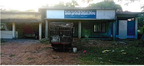
విద్యార్థులతో మూపతపడి ఉన్న రావులకొల్లు పాఠశాల భవనం

ప్రధానరహదారులు, వాగులు, నదులు అడ్డంగా ఉంటే ఆ పాఠశాల విద్యార్థులను తరలించడకూడదని చెప్పినా ఆ నిబంధనకూడా పరిగణలోకి తీసుకొనకపోతుండడంతో విద్యార్థుల తల్లిదండ్రులు, ఉపాధ్యాయ సంఘాలవారు, పలువురు ప్రజలు వ్యతిరేకిస్తున్నారు. దాంతో విద్యాశాఖాధికారులను ప్రక్కన బెట్టిన ప్రభుత్వం ఆర్డీవో తదితర అధికారులతో వివరాలు తెప్పించుకొని ప్రతిపాదనలు సిద్ధం చేశారని, అందుకు గాను పాఠశాల విద్యకమిటీల సమావేశాలు గురువారం నిర్వహించి సరికొత్త విధానానికి సమ్మతి తెలిపే తీర్మానాలు చేయించాలని నిర్ణయించగా పలు కమిటీల వారు తరగతుల విలీనానికి వ్యతిరేకంగా తీర్మానాలు చేస్తున్నారని తెలుస్తోంది. 3, 4కిలోమీటర్ల లోని పాఠశాలలకు విద్యార్థులు వెళ్ళాలంటే అత్యంత అసౌకర్యం, ఆందోళనకరంగా ఉంటుందని, గత ప్రభుత్వం విలీననిర్ణయంను రద్దు చేశారని సంబరపడుతుండగా ఈ ప్రభుత్వం కూడా తరగతుల విలీనం అంటుండడం బాధాకరంగా ఉందని, ఉప్పొంగిన సంతోషం క్షణాల్లో మటు