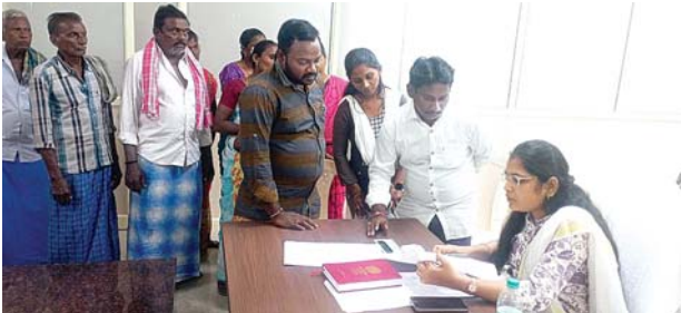
తరగతుల విలీనమొద్దంటూ ఆర్డీవోకు విన్నవిస్తున్న గ్రామస్థులు

ప్రధానరహదారులు, వాగులు, నదులు అడ్డంగా ఉంటే ఆ పాఠశాల విద్యార్థులను తరలించడకూడదని చెప్పినా ఆ నిబంధనకూడా పరిగణలోకి తీసుకొనకపోతుండడంతో విద్యార్థుల తల్లిదండ్రులు, ఉపాధ్యాయ సంఘాలవారు, పలువురు ప్రజలు వ్యతిరేకిస్తున్నారు. దాంతో విద్యాశాఖాధికారులను ప్రక్కన బెట్టిన ప్రభుత్వం ఆర్డీవో తదితర అధికారులతో వివరాలు తెప్పించుకొని ప్రతిపాదనలు సిద్ధం చేశారని, అందుకు గాను పాఠశాల విద్యకమిటీల సమావేశాలు గురువారం నిర్వహించి సరికొత్త విధానానికి సమ్మతి తెలిపే తీర్మానాలు చేయించాలని నిర్ణయించగా పలు కమిటీల వారు తరగతుల విలీనానికి వ్యతిరేకంగా తీర్మానాలు చేస్తున్నారని తెలుస్తోంది. 3, 4కిలోమీటర్ల లోని పాఠశాలలకు విద్యార్థులు వెళ్ళాలంటే అత్యంత అసౌకర్యం, ఆందోళనకరంగా ఉంటుందని, గత ప్రభుత్వం విలీననిర్ణయంను రద్దు చేశారని సంబరపడుతుండగా ఈ ప్రభుత్వం కూడా తరగతుల విలీనం అంటుండడం బాధాకరంగా ఉందని, ఉప్పొంగిన సంతోషం క్షణాల్లో మటు