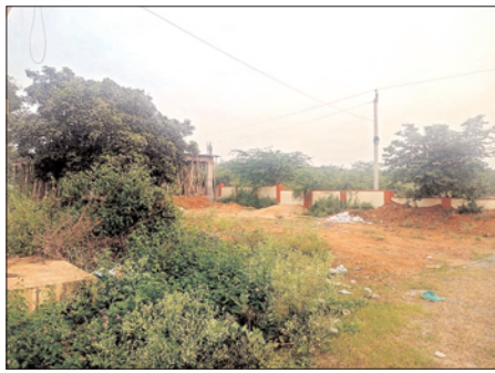
ఆరోగ్యసిబ్బంది ప్రజలకు అవగాహన కల్పించకపోవడం శుభ్రత పరిశుభ్రతపై ప్రభుత్వం ప్రత్యేక దృష్టి పెట్టిన ప్రతిష్ఠాత్మకంగా నిర్వహిస్తున్న స్వచ్ఛ ఆంధ్ర స్వచ్ఛాంధ్ర కార్యక్రమంపై వైద్య సిబ్బంది నిర్లక్ష్యం వహించడంపై పలువురు విస్మయం వ్యక్తం చేస్తున్నారు.

సి.ఎస్.పురం, మేజర్ న్యూస్: రాష్ట్ర ప్రభుత్వం ప్రతినెలా మూడవ శనివారం ప్రతిష్ఠాత్మకంగా స్వచ్ఛ ఆంధ్ర స్వచ్ఛ దివస్ కార్యక్రమం నిర్వహిస్తుండగా మండల కేంద్రమైన సి.ఎస్.పురంలోని ప్రభుత్వ ప్రాథమిక ఆరోగ్య కేంద్రంలో స్వచ్ఛ ఆంధ్రపై నిర్లక్ష్యంగా వ్యవహరించడం అందుకు నిదర్శనంగా ప్రభుత్వ సుపత్రి ఆవరణమంతా పిచ్చిమొక్కలు చెత్తాచెదారం ఉండటం, సువిశాలమైన మండలంలో 23 గ్రామ పంచాయతీలు సుమారు 40 గ్రామాలు ఉండగా వైద్యసిబ్బంది అందుబాటులో లేకపోవడం వైద్యపరీక్షలకు వచ్చిన ప్రజలు ప్రైవేటు వైద్యశాలలను ఆశ్రయించడం అంతేకాకుండా అత్యవసర వైద్యసదుపాయాలు లేకపోవడంతో ఎమర్జెన్సీ చికిత్సలకు సుదూర ప్రాంతంలో ఉన్న పామూరు, నెల్లూరు, ఒంగోలు వైద్యశాలలకు వెళ్లి చికిత్స పొందుతున్నారు. అంతేకాకుండా గ్రామాల్లో పారిశుధ్యం ప్రజారోగ్యంపై