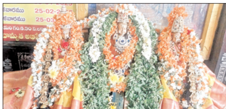
కమిటీ ప్రతినిధులు ప్రసాద వితరణ చేశారు. అర్చక స్వాములు, నిర్వహణ ప్రతినిధులు పాల్గొన్నారు.

చీరాల, మేజర్ న్యూస్: పట్టణంలోని బస్టాండ్ ప్రాంగణంలో కొలువుదీరిన శ్రీలక్ష్మి పద్మావతి సమేత వెంకటేశ్వరస్వామి ఆలయంలో గురువారం విష్ణు సహస్రనామ పారాయణం, అర్ధ ఏకహం కార్యక్రమం నేత్రపర్వంగా జరిగింది. ఈ సందర్భంగా ఉదయం 6 గంటల నుంచి సాయంత్రం 6 గంటల వరకు గుక్కతిప్పుకోకుండా మహిళలు అర్ధ ఏకహం పారాయణం చదివారు. అనంతరం దేవతామూర్తులకు విశేష పూజలు నిర్వహించారు. విచ్చేసిన భక్తులకు