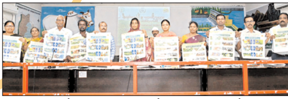
ఒంగోలు, మేజర్ న్యూస్: ప్రకృతి సేద్యాన్ని ప్రోత్సహించేలా మురింత దృష్టి పెట్టాలని జిల్లా కలెక్టర్ ఏ.తమిమ్ అన్వారియా చెప్పారు. ఈ దిశగా రైతులకు విస్తృత అవగాహన కల్పించాలని అధికారులను ఆదేశించారు.

రైతులకు విస్తృత అవగాహన కల్పించాలి జిల్లా కలెక్టర్ ఏ.తమిమ్ అన్వారియా అధికారులకు ఆదేశం