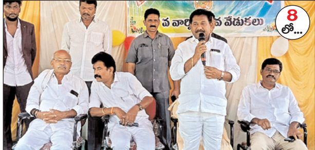
విలువతో కూడిన విద్యను అభ్యసించాలి: మంత్రి స్వామి