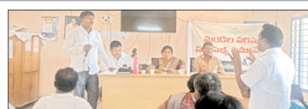
పాఠశాల ఉపాధ్యాయులు పాఠశాల కంటే ప్రయవేట్ రియలస్టేట్ పై ఎక్కువ సమయం కేటాయిస్తూ విద్యార్థుల భవిష్యత్ తుంగలో తొక్కుతున్నారని తెలిపారు. పాఠశాలలో జలజీవన్ ద్వారా నీటి కొరత ఏర్పాటు చేసినప్పటికీ విద్యార్థులకు నీటి సమస్యను కావాలని సృష్టిస్తున్నారని, తిన్న అన్నం కంచాలను ఇంటికి తీసుకుపోయి శుభ్రం చేసుకోవాల్సిన పరిస్థితి నెలకొన్నదని అన్నారు. అంతే కాదు మధ్యాహ్న భోజన పథకం మెనూ ఏర్పాటు చెయ్యలేదని, ఎవరైనా వెళ్లి పాఠశాలలో కి వెళ్లి అడిగితే నిర్లక్ష్య సమాధానం ఇస్తున్నారని తెలిపారు. ఈ కార్యక్రమంలో మండల అధికారులు, సర్పంచ్లు ఎంపీటీసీలు పాల్గొన్నారు.