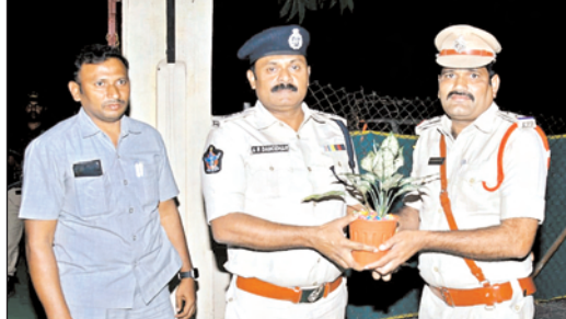
కనుక దానికి అనుగుణంగా పోలీస్ స్టేషన్ నిర్వహణ గుడ్ టచ్, బ్యాడ్ టచ్ పై విస్తృతంగా స్కూల్, ఉండాలని సూచనలు చేశారు. నేరాలు కట్టడికి గస్తీ కళాశాలల్లో విద్యార్థులకు అవగాహన కల్పించాలని,

ముమ్మూరం చేయాలని, అసాంఘిక కార్యకలాపాలు జరగకుండా నిరంతర గస్తీ నిర్వహించేటట్లు, నైట్ బీట్ డ్యూటీ చేస్తున్న సిబ్బందిని తరచూ అప్రమత్తంగా చెయ్యాలని, డయల్-112 ఫిర్యాదులు రాగానే వెంటనే స్టేషన్ సిబ్బంది సంబంధనా స్థలానికి చేరుకుని సమస్యను పరిష్కరించేటట్లు చూడాలని, విరివిగా విజిలెన్స్ పోలీసింగ్ నిర్వహించాలని, ట్రాఫిక్ నియంత్రణకు ప్రత్యేక చర్యలు తీసుకోవాలని, స్టేషన్లో వివిధ విధులు నిర్వహిస్తున్న సిబ్బంది నిరంతరం అప్రమత్తంగా ఉండాలని, విధుల పట్ల అంతాగాతంగా ఉంటూ ప్రజలకు ఎల్లప్పుడూ అందుబాటులో ఉండాలన్నారు. ప్రజలకు సినీ కెమెరాల పట్ల అవగాహన కల్పించి వాటి ప్రాముఖ్యతను వివరిస్తూ కెమెరాలు ఏర్పాటు చేసుకునేలా ప్రోత్సహించాలని సూచించారు. రోడ్డు ప్రమాదాల నియంత్రణకు ముందస్తు చర్యలు తీసుకోవాలని, ట్రాఫిక్ ను క్రమబద్ధీకరించాలని పోలీస్ అధికారులను జిల్లా ఎస్పీ ఆదేశించారు.