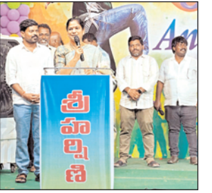
చదువుతోపాటు క్రమశిక్షణ కూడా పాటిస్తేనే జీవితంలో ఉన్నత స్థానానికి చేరుకోవచ్చు అని తెలియ