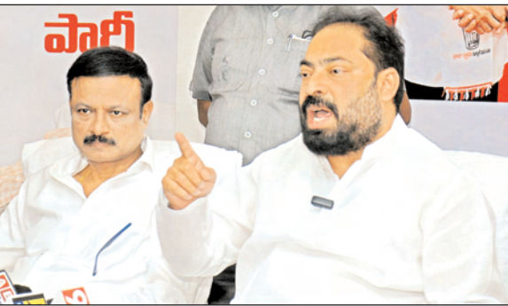
పంపించిన విషయాన్ని గుర్తు పెట్టుకోవాలని హితవు పలికారు. వైసిపి పాలనలో రాష్ట్రం సర్వ నాశనం అయిందన్నారు. కూటమి