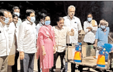
టంగుటూరు, మేజర్ న్యూస్: టంగుటూరు గ్రామంలో ప్రజల ఆరోగ్యం దృష్ట్యా ముందస్తు చర్యలలో భాగంగా డోమల నిర్మూలనకు ప్రత్యేక చర్యలు తీసుకుంటున్నట్లు మాజీ