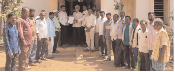
వినతి పత్రం అందిస్తున్న బాధిత రైతులు కుల్చపర్ల రూరల్, మేజర్ న్యూస్ (ఫిబ్రవరి 18): వారసత్వంగా వస్తున్న మా భూములను మాకు కేటాయించాలని మండల కేంద్రానికి చెందిన కొందరు రైతులు మంగళవారం తాహసిల్దార్ కార్యాలయంలో వినతి పత్రం అందజేశారు.

● తాహసిల్దార్ కార్యాలయంలో బాధిత రైతుల వినతి