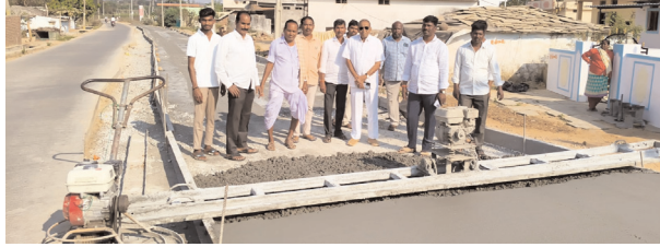
రోడ్డు పనులు పరిశీలిస్తున్న కాంగ్రెస్ నాయకులు