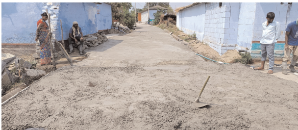
వేసిన సీసీ రోడ్డు.