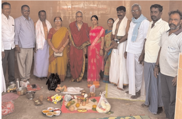
తలకొండపల్లి, మేజర్ న్యూస్ (ఫిబ్రవరి 22) : మండల పరిధిలోని చెన్నారం