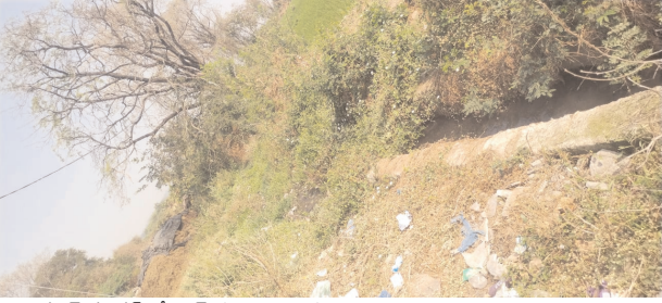
తాండూర్ రూరల్, మేజర్ న్యూస్(ఫిబ్రవరి 22):