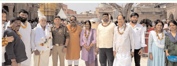
కాశీ విశ్వనాథుని సన్నిధిలో స్పీకర్ ప్రసాద్ కుమార్.

వికారాబాద్ జిల్లా ప్రతినిధి, మేజర్ న్యూస్ (ఫిబ్రవరి 22): వారణాసి (ఉత్తరప్రదేశ్)లో ప్రసిద్ధ చెందిన కాశీ విశ్వనాథ దేవాలయాన్ని శనివారం రాష్ట్ర అసెంబ్లీ స్పీకర్ గడ్డం ప్రసాద్ కుమార్ సందర్శించి స్వామి వారికి పూజలు చేశారు. స్పీకర్ ప్రసాద్ కుమార్ కాశీ విశ్వనాథ దేవాలయంతో