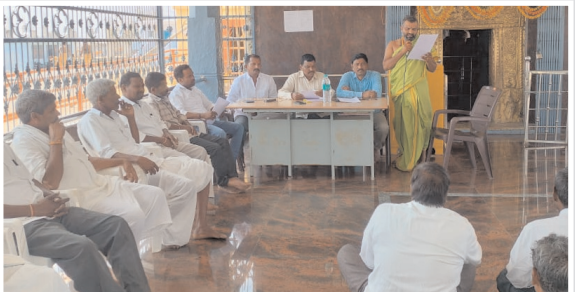
పాంబండ్ దేవాలయంలో తలనీలాల పొగుకు నిర్వహిస్తున్న దృశ్యం.