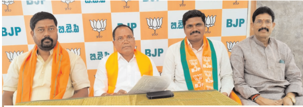
సమస్యలపై స్పందించాలని పత్రికల ద్వారా తెలియజేయుట.