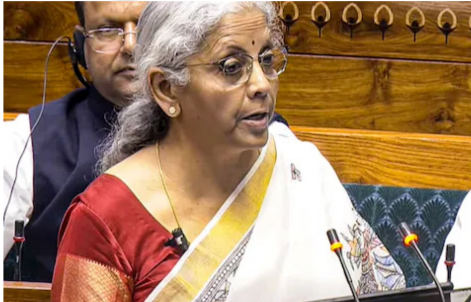
అనుమతి లక్ష ఇళ్ల నిర్మాణం కోసం రూ.15వేల కోట్లు