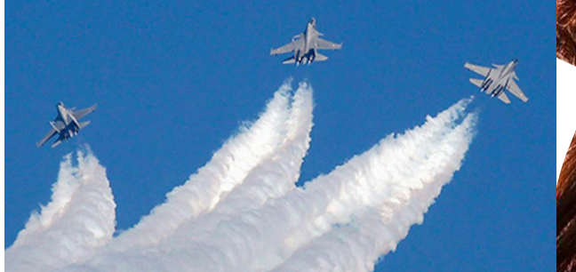
14సార్లు ఎయిర్ షోలు జరగగా... ఇది 15వ ఎయిర్ షో. అలాగే ప్రతీసారి బెంగళూరు ఎయిర్ షోకి అతిథ్యముస్తూ వస్తోంది. మరోవైపు ఎలాంటి ఇబ్బందులు కలగకుండా పక్కంటిగా ఏర్పాట్లు చేసింది కేంద్రం. ఎయిర్ షో చూసేందుకు పలురాష్ట్రాల నుంచి బెంగళూరు వస్తుండటంతో భారీ భద్రత ఏర్పాటు చేశారు.

ఇండియాస్ బిగ్గెస్ట్ ఎయిర్ షో మొదలైంది. భారత్ పాటు ప్రపంచవేదికల యుద్ధవిమానాలు గగనతలంలో సందడి చేస్తున్నాయి. రెండేళ్లకోసారి అత్యంత ప్రతిష్టాత్మక జరిగే ఈ షోకి వేదికైంది బెంగళూరులోని యలహాంక. జనవరి 10 నుంచి 14వరకు జరగనుంది ఎయిర్ షో. 'ది రన్ వే టు ది బిలియన్ అపార్చునిటీస్' అనే థీమ్ తో జరుగుతుంది ఎయిర్ షో. ప్రపంచవేదికల యుద్ధవిమానాలు షోలో పాల్గొంటున్నప్పటికీ అందరి దృష్టి ఇండియా, రష్యా, అమెరికాపైనే ఉంది. అయితే ఈసారి అప్డేట్డ్ బిక్కాబ్ తో అద్భుత ప్రదర్శన ఇచ్చేందుకు రష్యా ఉమ్మిళ్లూతోంది. రష్యా రూపొందించిన ఎస్యూ-57, అలాగే అమెరికాకు చెందిన ఎఫ్-35 లైట్నింగ్ 2 విమానాలను ఈ షోలో ప్రత్యేకంగా ప్రదర్శించనున్నారు. ఈ ప్రదర్శనలో 90 వరకు చేశాల ప్రాతినిధ్యం వహించనున్నట్లు అధికారులు తెలిపారు. కేంద్ర రక్షణశాఖ ఈ ఎయిర్ షోని 1996 నుంచి రెండు సంవత్సరాలకోసారి నిర్వహిస్తూ వస్తోంది. ఇప్పటివరకు