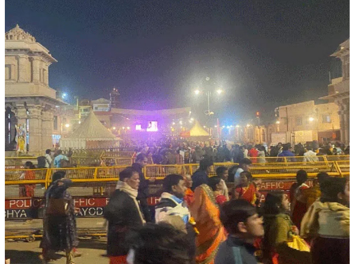
మూసివేస్తారు. ఇక ఆ రోజుకు సంబంధించిన బహుళ హారతి రాత్రి 10 గంటలకు నిర్వహిస్తారు. శయన హారతి మొన్నటి వరకు రాత్రి 9.30 నిమిషాలకు ఉండేది. శయన హారతి ముగిసిన తర్వాత ఆ రాత్రికి ఆలయాన్ని మూసివేస్తారు.

ఉత్తరప్రదేశ్ ప్రస్తుతం హిందూ భక్తులతో కిటకిటలాడుతున్నది. మహాకంభలో పుణ్యస్నానాల కోసం వెళ్తున్న ప్రజలు.. అయోధ్య, కాశీ విశ్వనాథ్ ఆలయాలను కూడా దర్శించుకుంటున్నారు. అయితే ప్రతి రోజు లక్షలాది సంఖ్యలో ఈ రెండు ఆలయాలను భక్తులు సందర్శిస్తున్నారు. ఈ నేపథ్యంలో అయోధ్యలోని కొత్తగా నిర్మించిన రామాలయ దర్శన వేళల్లో మార్పులు చేశారు. శ్రీరామ జన్మభూమి తీర్థ క్షేత్ర ప్రస్తుత దినపై ప్రకటన చేసింది. ఉదయం ఆరు గంటల నుంచి రాత్రి 10 గంటల వరకు ఆలయాన్ని భక్తుల దర్శనం కోసం తెరిచి ఉంచనున్నట్లు ఆలయ ప్రస్తుత పేర్కొన్నది. మొన్నటి వరకు ఆలయాన్ని ఉదయం 7 గంటలకు తెరిచేవారు. ఇప్పుడు ఓ గంట ముందు సాధారణ ప్రజల దర్శనం కోసం తెరుస్తున్నారు. దర్శన సమయంలో మార్పులతో పాటు హారతి పెడతూతున్న కూడా మార్చారు. మొన్నటి వరకు మంగళహారతి ఉదయం 4.30 నిమిషాలకు జరిగేది. ఇప్పుడు మంగళ హారతిని ఉదయం 4 గంటలకే నిర్వహించనున్నారు. అయితే హారతి కోసం టికెట్ తీసుకోవాల్సి ఉంటుంది. 15 రోజుల ముందే ఆ టికెట్లు ఇస్తారు. ఉదయం 4 గంటల హారతి తర్వాత ఆలయాన్ని కొంత సేపు మూసివేస్తారు. ఆ తర్వాత ఉదయం ఆరు గంటలకు శ్రీంగార హారతి ఇస్తారు. ఆ హారతితో సాధారణ ప్రజల దర్శనం కోసం ఆలయాన్ని తెరిచి ఉంచుతారు. రామలక్ష్మణ మధ్యాహ్నం 12 గంటలకు రాజభోగ్ గను సమర్పించనున్నట్లు ఆలయ ప్రస్తుత పేర్కొన్నది. అయితే ఆ సమయంలో భక్తులను దర్శనం కోసం అనుమతిస్తారు. రాత్రి ఏడు గంటలకు సంద్యా హారతి ఇవ్వనున్నారు. ఆ టైంలో 15 నిమిషాల పాటు ఆలయ ద్వారాలను