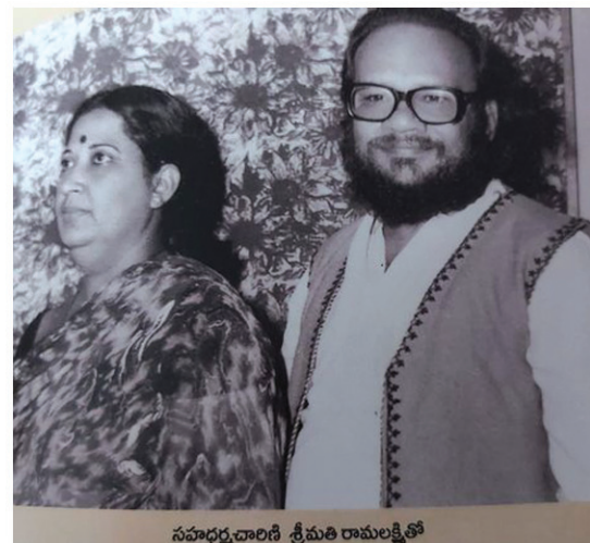
(మిగతా 8వ పేజీలో)

సూపర్ స్టార్ కృష్ణతో అనుబంధం... సూపర్ స్టార్ కృష్ణ సొంత నిర్మాణ సంస్థలో నిర్మించి, నటించిన మోసగాళ్ళకు మోసగాళ్ళు చిత్రం తెలుగులో తొలి కౌబోయ్ సినీమా. ఈ చిత్రానికి కథను సమకూర్చింది ఆరుద్రనే. ఆరుద్ర దంపతులకు ఆంగ్ల సాహిత్యంతో పాటు, ప్రపంచ సినీమాలతోనూ పరిచయం ఉంది.