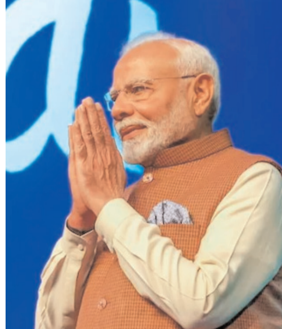
తగ్గాయి. ఢిల్లీలో ఇందులో హరియాణా ప్రభుత్వ హస్తం ఉన్నట్లు స్పష్టమవుతోంది అని కేజ్రీవార్ల అన్నారు.

అది ఆపే సర్కార్ కుంభకోణం అని విమర్శించారు. దేశాన్ని పాలించే అవకాశాన్ని తనకు ప్రజలు పలుకావచ్చు కల్పించారని, అలాగే ఢిల్లీని పరిపాలించే అవకాశాన్ని ఇవ్వాలని ఓటర్లను కోరారు. ఆపే అందరితో గొడవలు పెట్టుకోవడంలో బిజీగా ఉందని మండిపడ్డారు. యమనా నదీని వివక్షలం చేశారంటూ అందరినీ కేజ్రీవార్ల చేసిన వ్యాఖ్యలను ఉద్దేశించి మోడీ ఈ విధంగా వ్యాఖ్యానించారు. ఢిల్లీ అసెంబ్లీ ఎన్నికలు దగ్గరపడుతున్న వేళ ఢిల్లీలో యమనా నది కాలువపై రగడ నానాటికి ముదురుతోంది. ఎన్నికలను ప్రభావితం చేయడానికి హరియాణా ముఖ్యమంత్రి కుట్రచేస్తున్నారని కేజ్రీవార్ల ఆరోపించారు. జనవరి 15 తర్వాత శతృవ్యక్తంగా నీటిలో అమోగింపు మోతాదు అధికమైపట్టు గురించాం. దానికి ముప్పు భాధులను చేయాలని కుట్ర పన్నుపట్టు పనిగట్టిన సీఎం అతికి ఈ విషయం ప్రజలకు తెలిసేలా చేశారు. మేం చేస్తున్న పోరాటం పట్ల ఇప్పుడు నీటిలో అమోగింపు స్థాయిలు 2.1కు