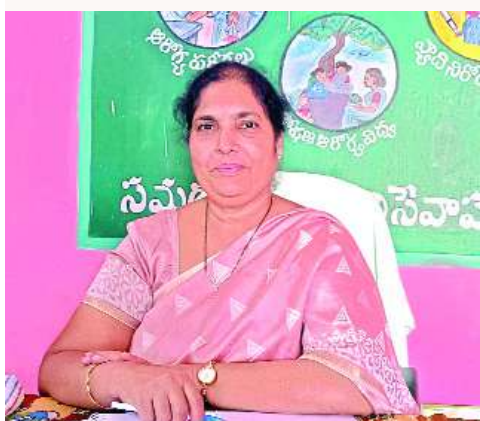
గుమ్మలక్ష్మీపురం, ఫిబ్రవరి 14, (మేజర్ స్పాన్).