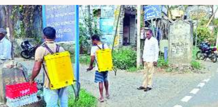
మునగపాక ఫిబ్రవరి 14 మేజర్ స్పాన్