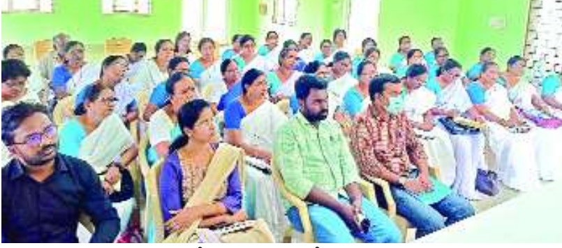
పార్శ్వతిపురం, ఫిబ్రవరి 14, మేజర్ స్టూన్స్ :