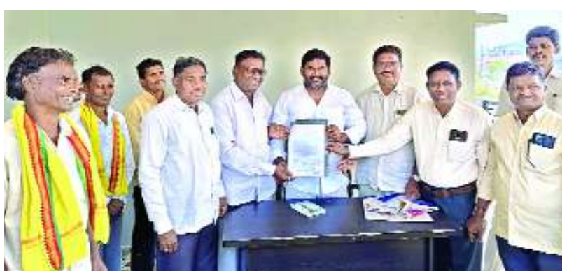
సీతానగరం ఫిబ్రవరి 14 మేజర్ స్పాన్

మండలంలోని కోట సీతారాంపురం, పూసబుచ్చిపేట, జానుమల్లవలస, గాంధీవలస గ్రామాలకు బోర్నిలి నియోజకవర్గంలో కలవరాయి, వాకాడవలస, అన్నంనాయుడు వలస గ్రామాలకు వెంగలరాయ సాగర్ ఆయకట్టు మిగులు జలాలు వచ్చే చర్యలు తీసుకోవాలని కోరుతూ ఆయా గ్రామాల డిడిపివారులు ప్రజాప్రతినిధులు ఎమ్మెల్యే బోసెల విజయ్ చంద్రకు వినితిపత్రం అందజేశారు. ఆయా గ్రామాల పరిధిలో గల చెరువులు నింపుటకు మహారూ 20 సం.గా ప్రతిపాదనలు చేస్తున్న పరిష్కారం జరగడం లేదని తెలిపారు. కలవరాయి, వాకాడవలస గ్రామాలలో భూ సేకరణ జరిగి రైతులు సొమ్ము పంపిణీ చేసేయవచ్చని, మధ్య మధ్యలో కాలను తీసి అసంపూర్ణంగా పనులు నిలుపుడం చేశారన్నారు. ఆయా గ్రామాల భూములలో నీటివసతి సదుపాయాలు లేక పంటలు పండడం లేదన్నారు. ఎమ్మెల్యే గారు దయచేసి వెంగలరాయ అడవల్ల ఆయకట్టు మిగులు జలాలు మా గ్రామాల చెరువులలో నీటిని నింపేందుకు నిధులు మంజూరు చేయించి గ్రామాల రైతుల అభివృద్ధికి కృషి చేయాలని ఎమ్మెల్యేని కోరారు. ఈ కార్యక్రమంలో సర్పంచి, ఎంపీటీసీలు, నీటి వినియోగదారుల సంఘ అభ్యుదయ