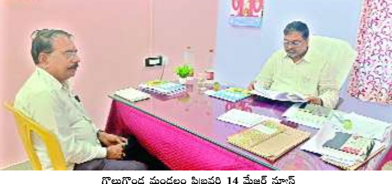
గొలుగొండ మండలం ఫిబ్రవరి 14 మేజర్ స్టూన్