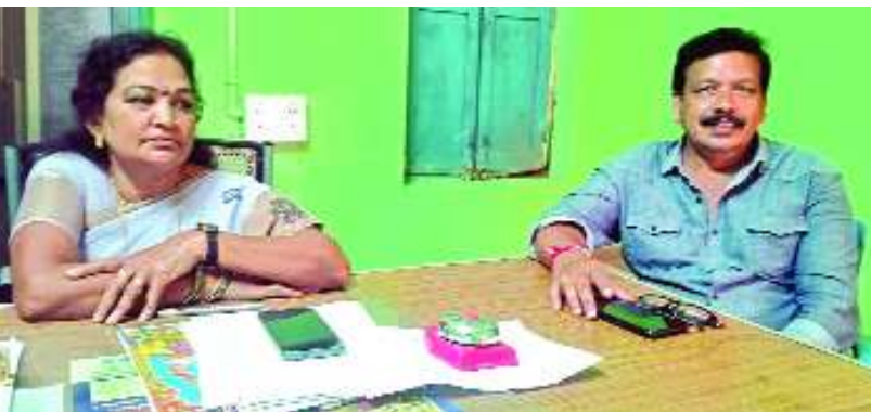
గురుగుబిల్లి, ఫిబ్రవరి 14, మేజర్ స్పాన్:

-ఎంపీడివో పైడితల్లి, ఏపీవో గారి నాద్ లు, వెల్లడి -"సూర్య" దినపత్రిక వార్తకు స్పందన - తోటపల్లి, కె ఆర్ ఎన్ వలస, గ్రామాల్లో కాంపౌండ్ వాల్స్ పనులు రద్దు-మిగిలిన పంచాయతీలో యూధా విభిగా కాంపౌండ్ వాల్స్ నిర్మాణం... ఎంపీడివో పైడితల్లి