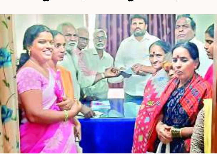
నెల్లిమర్ల, ఫిబ్రవరి 14, మేజర్ స్పాన్: