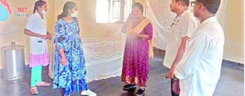
పార్వతిపురం రూరల్ ఫిబ్రవరి 14 (మేజర్ స్టూన్):