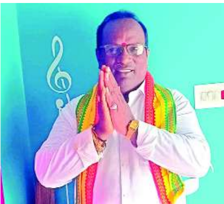
గురుగుబిల్లి, ఫిబ్రవరి 14, మేజర్ స్పాన్: