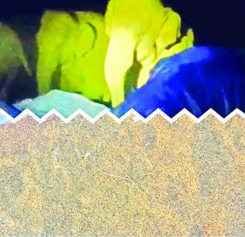
గరుగుబిల్లి, ఫిబ్రవరి 14, మేజర్ స్టూన్:

-శ్రీవెంకట గాయత్రి రైస్ మిల్లులో ధాన్యం బస్తాలను ధ్వంసం చేసిన కలిరాజులు-ఏనుగులు సంచారంతో భయ భ్రాంతులు వ్యక్తం చేస్తున్న స్థానికులు-పంట పొలాలకు వెళ్లేందుకు భయాందోళనలు వ్యక్తం చేస్తున్న గ్రామస్థులు