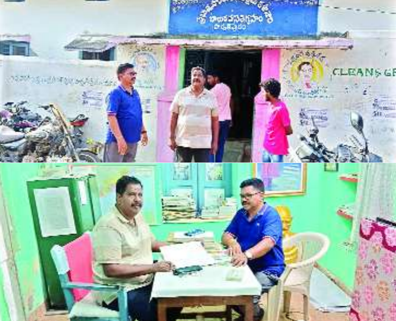
పార్వతిపురం, ఫిబ్రవరి 14, మేజర్ స్టూన్ :