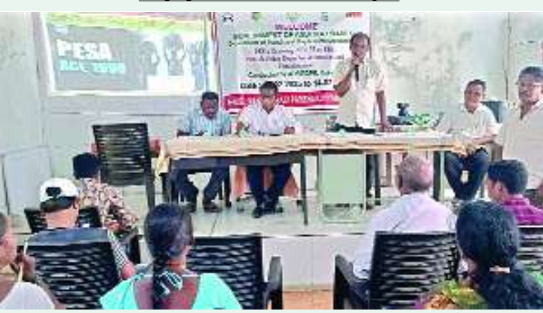
గుమ్మలక్ష్మీపురం, ఫిబ్రవరి 14, (మేజర్ స్పాన్).

జియమ్మ వలస మండల పరిషత్ కార్యాలయంలో పీసా చట్టంపై ప్రజాప్రతినిధులు, అధికారులకు శిక్షణ కార్యక్రమం నిర్వహించారు. ఈ సందర్భంగా ఎంపీడిఎ ఎన్. రమేష్ మాట్లాడుతూ, 1964 పంచాయతీరాజ్ చట్టంతో సమానంగా గిరిజన ప్రాంతాల ప్రజలకు పీసా చట్టం ద్వారా అనేక హక్కులను ప్రభుత్వం కల్పించిందన్నారు. పెద్దపల్లె గ్రామంలో పీసా చట్టం కు విశిష్ట అధికారిని ప్రభుత్వం కల్పించిందన్నారు. గ్రామపంచాయతీలో ఏ కార్యక్రమాన్ని అయినా గ్రామ సభ ఆమోదిస్తే పంచాయతీ సభ్యుల తీర్మానాలు చెల్లుబాటు అవుతాయని ఆయన తెలిపారు. గిరిజన ప్రాంతాల్లో అటవీ సంపద, మైనింగ్, నీటిపారుదల సహజ వనరులు మొదలైన వాటిపై పంచాయతీ సభ్యుల తీర్మానం తో పాటు గ్రామప్రజలు సంఘాల తీర్మానాలకు కూడా అంతే ప్రాధాన్యత ఉంటుందన్నారు. ఈ కార్యక్రమానికి డ్రాక్సిని, కొండవీలుకూ, కొండ నిడగల్లు బల్లెర్ల, తిలకమ్మ, గోర్తి, గోర్తి వలస, కూలాం, పాండ్రపిని కలిపిన గ్రామాల నుండి మహిళా సంఘాల సభ్యులు హాజరయ్యారు