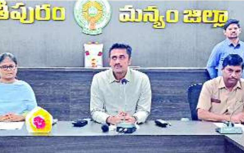
పార్వతిపురం, ఫిబ్రవరి 14, మేజర్ స్టూన్ :