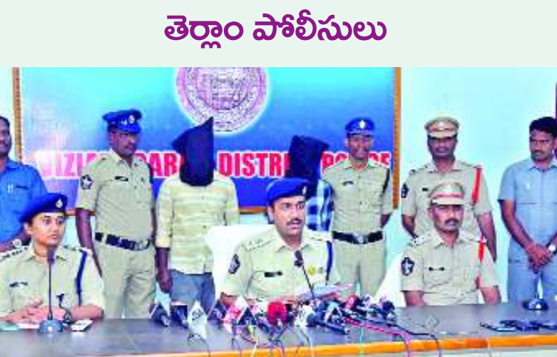
విజయనగరం బ్యారో, ఫిబ్రవరి 14, మేజర్ స్పాన్ :