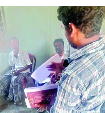
కొయ్యూరు ఫిబ్రవరి 14 మేజర్ స్టూన్స్ :

పంపాచి దొడ్డవరం ఎన్.ఆర్.టి.లో ఏఆర్ పీ ఐ.ఆర్. సర్టిఫైడ్ గత కొంత కాలంగా పలు అవకాశాలకు పాల్పడుతున్నారంటూ సర్పంచ్, గ్రామస్థులు, ఉపాధి కర్తలు ఆలోచనలు చేయడం విచిత్రమే... ఈ క్రమంలో గురువారం సర్పంచ్ మరియు తెలుగుదేశం నాయకులు “వి ఆర్ పీ” విధులలో పాల్పడుతున్న ఉద్యోగుల తెలియ పరచుతూ ఆడిట్ విధులను ఏ తొంగింది కొత్త వారిని నియమించాలని మండల అధికారులకు వివరాల పత్రం అందించారు. ఈ ఫిర్యాదు ఆధారంగా దొడ్డవరం లో ఎమ్ పీ డి.ఓ. ఏ.ఎస్. కే