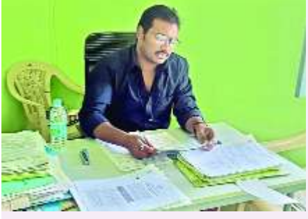
పార్శ్వతిపురం రూరల్ ఫిబ్రవరి 14 మేజర్ స్టూన్స్: