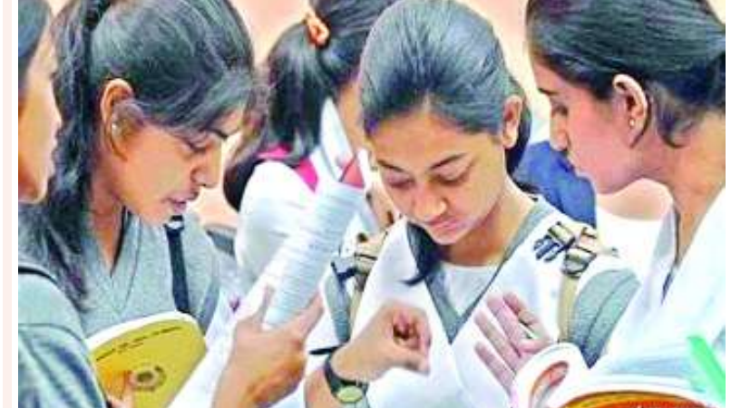
నరసంపేట ఫిబ్రవరి 14 మేజర్ స్టూన్స్ :