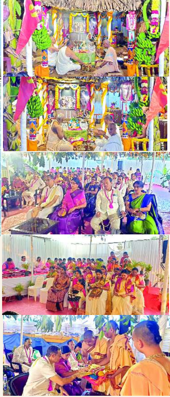
అనంతపురం ఫిబ్రవరి 14 మేజర్ స్టూన్