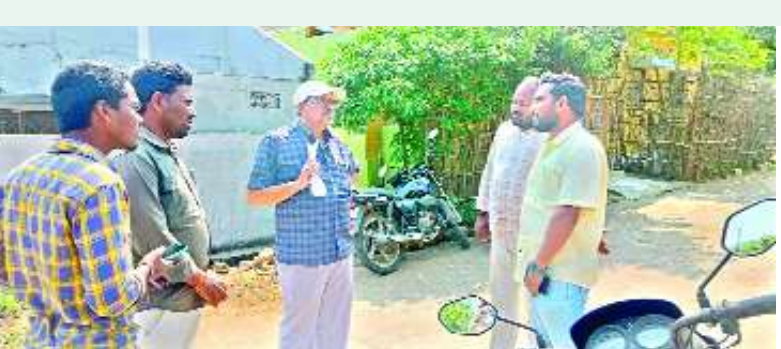
నెల్లిమర్ల, ఫిబ్రవరి 14, మేజర్ స్పాన్:

ఎంఎస్ఎంఇ సర్వేకి వ్యాపారులు సహకరించాలని కమిషనర్ కె అప్పలరాజు కోరారు. నెల్లిమర్ల నగరపంచాయతీ పరిధిలో శుక్రవారం సచివాలయ కార్యదర్శులు నిర్వహిస్తున్న మైక్రో, స్మాల్, మీడియం ఎంటర్ ప్రైజెస్ సర్వే కమిషనర్ పరిశీలించారు. ఆయన మాట్లాడుతూ ప్రభుత్వ కార్యాలయాల, చర్యలు, పనులు, దేవాలయాల విసర్వే చిన్న, పెద్ద కమర్షియల్ ట్రేడలన్నింటి వివరాలను ఈ సర్వేలో పొందుపరిచి ప్రభుత్వానికి నివేదిక ఇవ్వమని చెప్పారు. సర్వే వల్ల ఆయా వ్యాపార సంస్థలకు శీక్షణ, ఉపాధి, ఆర్థిక ప్రయోజనాలు చేకూరుతాయని తెలిపారు.