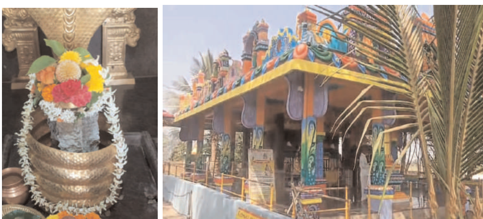
పంచవొమ్మాలి, ఫిబ్రవరి 25, మేజర్ న్యూస్ :

మండల కేంద్రం సంతబొమ్మాలి కోవెల జంక్షన్ లో వెలసిన శ్రీ ఉమా పాలేశ్వరుని ఆలయం మహా శివరాత్రి పర్వదినం సందర్భంగా రంగులతో సుందరంగా ముస్తా భుష్టించి . ఉమా పాలేశ్వర స్వామి ఆలయం తో పాటు దిర్గా అమ్మవారు ఆలయం, సవ గ్రహాల ఆలయం, రాహు కేతువు, పార్వతి ఆలయం లకు రంగులు వేసి విద్యుత్ దీపాలతో సుందరంగా అలంకరించారు. ఆలయ కమిటీ సభ్యులు అధ్యక్షులలో వలపురు భక్తులు సహకారం తో ఆలయం సుందరంగా రూపుదిద్దినట్లు తెలిపారు. శివరాత్రి వచ్చినందులో శివునికి అభిషేకాలు, ఉపవాసాలు, జాగరాలు ఇక్కడ ప్రత్యేక తలు. దాదాపు 200 సంవత్సరాల క్రితం స్వయంబు లింగం తో వెలసిన శ్రీ ఉమాపాలేశ్వరుడు ఆలయం గ్రామ పంచాయతీ పరిధిలో ని భక్తులు తోపాటు మండలం చుట్టూ పక్కల గ్రామాలకు చెందిన భక్తులు, ఇక్కడ నుండి వలస పోయి ఒడిస్సా లో నివాసం ఉంటున్న భక్తులు అందించిన సహకారం తో సుందరంగా రూపు దిద్దు కొంది. ఈ పర్వదినం సందర్భంగా ఉమా పాలేశ్వర స్వామికి బుధవారం ప్రత్యేక పూజలు, లింగార్చన కార్యక్రమం, భజనలు, సాంకృతిక కార్యక్రమాలు జరగనున్నాయి.