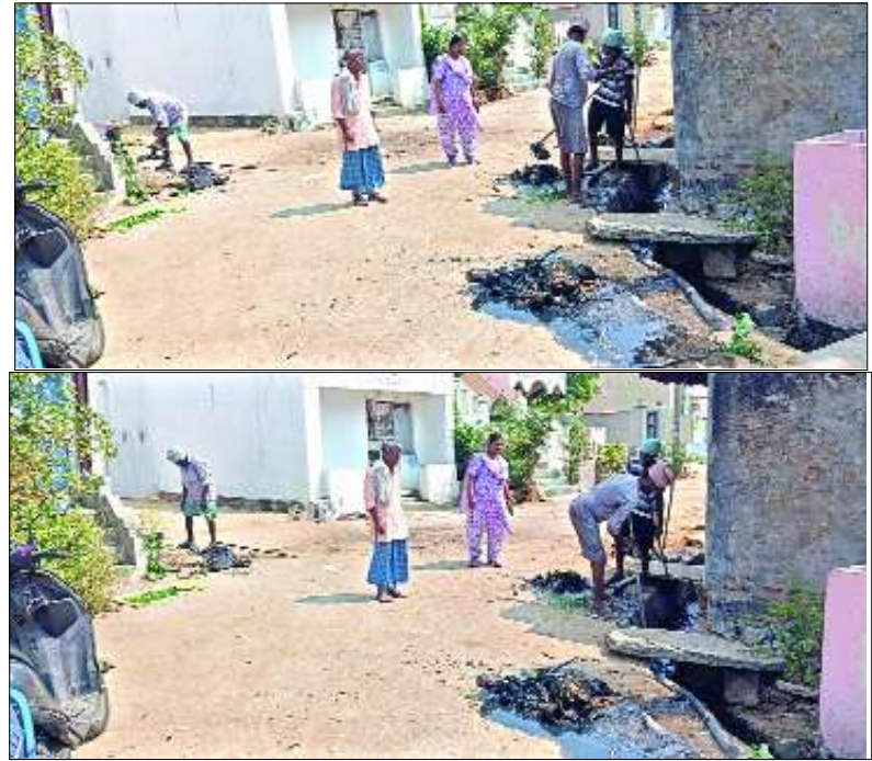
మెరకముడిదాం ఫిబ్రవరి 25 మేజర్ స్టాన్స్.

దూరంగా డంపింగ్ యార్డ్ వద్ద డంప్ చేస్తున్నారన్నారు. అనంతరం గ్రామంలో నీటి గుంటల వద్ద, ములుగు కాలువలో, బోరు బావుల వద్ద, పరిశుభ్ర పరిసరాల వద్ద ట్రిలింగ్ జబ్లి క్రోసేషన్ నేషన్ చేపడుతున్నా మన్నారు. ఈ సందర్భంగా గ్రామంలో ప్రజలందరికీ ఇంటి చుట్టూ రోడ్డుపై పరిసరాల పరిశుభ్రంగా ఉంచుకోవాలని, చెత్తను వేసి ఉంచాలన్నారు. ఇంటి చుట్టూ పరిసర ప్రాంతాలు పరిశుభ్రంగా ఉంచుకుంటే దోమలు దరిచేరకుండా ప్రజలు అనారోగ్యానికి గురికాకుండా ఉంటారని అవగాహన కల్పించారు. గ్రామంలో నీటి రోడ్డు పైనే పశువులను కట్టడం గాని వ్యవసాయతర వ్యూహాలను రోడ్డు పై నేసిన వారిపై చర్యలు తీసుకుంటామని ఈ సందర్భంగా ఆమె తెలియజేశారు. అలాగే భోజనం చేసే ముందు కానీ అనంతరం కాళ్ళు చేతులు పరిశుభ్రంగా కడుక్కోవాలన్నారు ఈ కార్యక్రమంలో గ్రామ సచివాలయ సిబ్బంది కార్మికులు తదితరులు పాల్గొన్నారు.