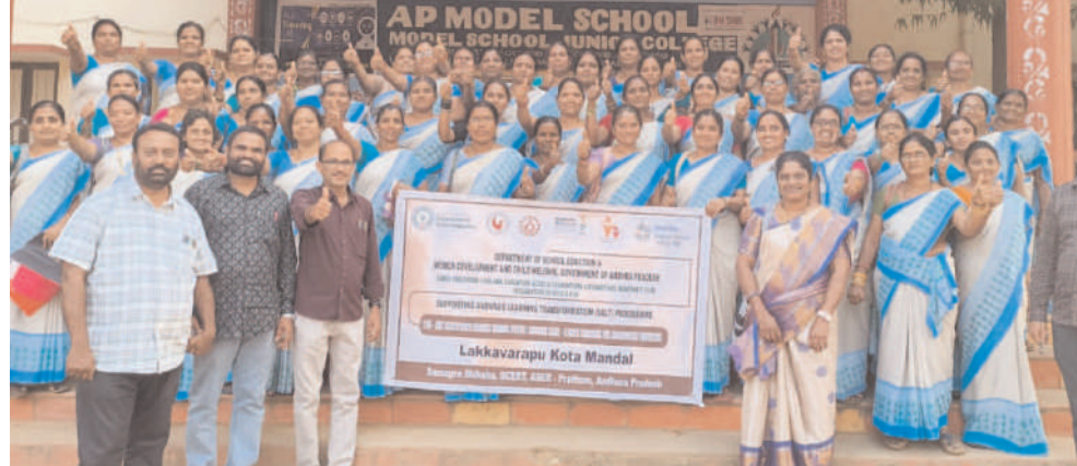
లక్ష్మవరపుకోట, ఫిబ్రవరి 25, మేజర్ న్యూస్:

మండలములోని ఏపీ మోడల్ స్కూల్ లో అంగన్వాడీలకు 120 రోజుల శిక్షణలో భాగంగా 6 రోజులు ఆఫ్ లైన్ తరగతులు ఎల్ కోట ఎం ఈ ఓ 2 అధ్యక్షులతో మంగళ వారం తో ముగియాలి ఈ ఆరు రోజుల్లో పిల్లలో అభివృద్ధి అభివృద్ధి మెరుగు పరుచుట 3 నుంచి 6 ఏండ్ల వయసు గల పిల్లల్లో సమగ్ర అభివృద్ధి ని ఎలా సాధించాలి అనే విషయాల పై ఈ నెల 18 నుంచి 25 వ తేదీ వరకు బి సి డి ఎస్ మండల విద్యాశాఖ సంయుక్తముగా ఈ తరగతులు నిర్వహించినట్లు ఎం ఈ ఓ తెలిపారు ఈ కార్యక్రమం లో బి సి డి ఎస్ సూపర్వైజర్ మండల విద్యాశాఖ అధికారులు అంగన్వాడి కార్యకర్తలు పాల్గొన్నారు.