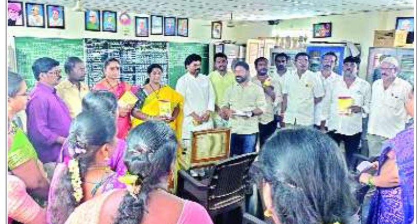
నక్కవల్లి ఫిబ్రవరి 25 మేజర్ స్టూన్: