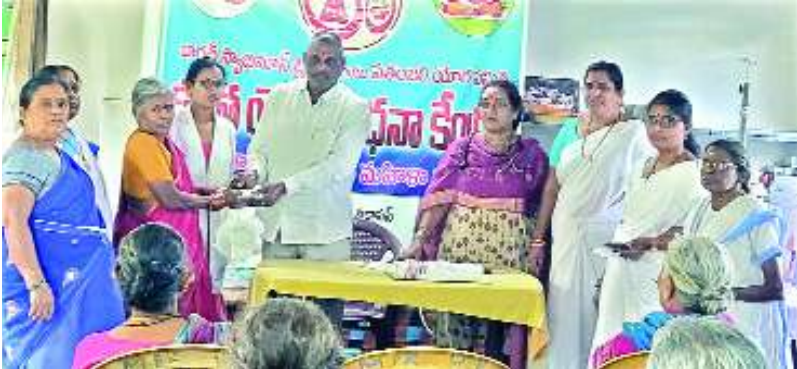
మునగపాక ఫిబ్రవరి 4 మేజర్ స్టూన్స్