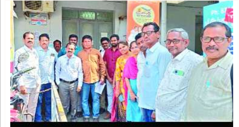
నర్సపట్నం, ఫిబ్రవరి 4, మేజర్ స్వామి.

నర్సపట్నంలో సోమవారం రాత్రి సమయం లో నర్సపట్నం మెయిన్ రోడ్ లో గల శ్రీ మారుతి ఆటో మార్ట్ ( అమరాన్ బ్యాటరీ) షాప్ యొక్క పెట్రోల్ కు సోమ తాళాలను పగలగొట్టి షాప్ లో నుండి 50 వేల రూపాయలు సగమును గుర్తు తెలియని దొంగలు దొంగిలించుకొని పోయారు. వచ్చిన ఫిర్యాదు మేరకు సర్కిల్ ఇన్స్పెక్టర్ గోవిందరావు సిబ్బందితో కలిసి సదరు దొంగతనం స్థలం కు మరియు క్లూస్ టీమ్ సహాయం తో నేరం జరిగిన తీరును పరిశీలించి దొంగలని పట్టుకోవడానికి దర్యాప్తు ప్రారంభించినట్లు తెలిపారు.