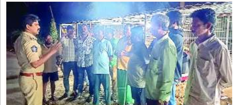
మునగపాక, ఫిబ్రవరి 4, మేజర్ స్వామి.

ముందల కేంద్రమైన మునగపాక బహిరంగ ప్రదేశంలో మద్యం తాగుతున్న 20 మందిపై కేసు నమోదు చేసినట్లు స్థానిక ఎస్పి పి.బ్రహ్మాంధ్ర రావు తెలిపారు, ఎవరైనా సరే బహిరంగ ప్రదేశాలలో మద్యం సేవించినట్లు దొరికితే కఠిన చర్యలు తప్పవని అన్నారు, అలాగే మండలంలో మద్యం గొలుసు దుకాణాలు ( బెల్ట్ షాపులు) నిర్వహించిన కఠిన చర్య తప్పవని అన్నారు