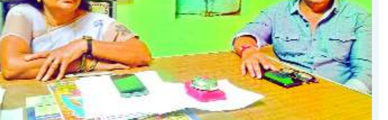
గురువీధి,ఫిబ్రవరి 4, మేజర్ స్టూన్స్:

-ఈనెల 26వ తేదీలోగా కాంపౌండ్ వాల్స్ నిర్మాణం పనులు పూర్తి చేయాలి