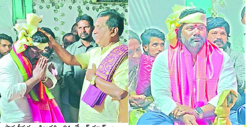
పార్వతీపురం, ఫిబ్రవరి 04, మేజర్ స్టాన్ :