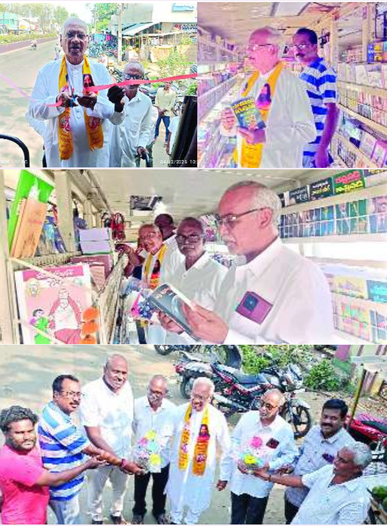
పార్వతీపురం, ఫిబ్రవరి 04, మేజర్ స్వామి :

పార్వతీపురం మున్సిపల్ జిల్లా కేంద్రంలో విశాలాంధ్ర సంచార పుస్తకాలయాన్ని జిల్లా కేంద్రానికి చెందిన సాహితీవేత్తలు, బార్ అసోసియేషన్ నేతలు, ఎన్టీఆర్ యూనివర్సిటీ నాయకులు, ఎలెమెంటరీ నాయకులు, ఎలెమెంటరీ బ్రాంచ్ నాయకులు, విశాలాంధ్ర విలేజ్ కలెక్షన్ ప్రారంభించారు. మంగళవారం స్థానిక రైతు బజార్ కూడలి సమీపంలో విశాలాంధ్ర సంచార గ్రంథాలయం ప్రారంభోత్సవానికి వారు మాట్లాడుతూ జిల్లా ప్రజలు సాహిత్య ప్రముఖులు విద్యార్థులు అన్ని వర్గాల వారు విశాలాంధ్ర సంచార పుస్తకాలయాన్ని సద్వినియోగం చేసుకోవాలని వారంతా కోరారు. విశాలాంధ్ర ఐక్య హోస్టల్ కు తెలుగు రాష్ట్రాల్లో ప్రత్యేక గుర్తింపు ఉందని తెలిపారు. పుస్తక పఠనం యువత అలవాటు చేసుకోవాలని పుస్తక పఠనం ద్వారా ప్రపంచాన్ని తెలుసుకోవచ్చని తెలియజేశారు. ముఖ్యంగా నేటి యువత పుస్తకాలకి దూరమై సోషల్ మీడియాకు దగ్గర అయ్యారని, సోషల్ మీడియా విజ్ఞానం కంటే యువతని జ్ఞానం వైపు, అక్షరాల వైపు నడిపిస్తుండవచ్చు. యువతరం పుస్తకాలు చదవడం అలవాటు చేసుకోవాలని, ఈ సంచార పుస్తకాలయం పుస్తక ప్రేమికులకు మరింత చేరువ అయ్యేందుకు మరియు పుస్తక పఠనానికి పెంపొందించడానికి విశాలాంధ్ర ప్రపంచం సంస్థ విశేష కృషి చేస్తుందన్నారు. ఈ సంచార గ్రంథాలయాన్ని జిల్లా వ్యాప్తంగా నడపడం అభినందినీయమన్నారు. ప్రతి ఒక్కరికీ విశాలాంధ్ర పుస్తకాలను అందుబాటులోకి తీసుకురావాలనే ఉద్దేశంతో ఈ సంచార గ్రంథాలయాన్ని ఏర్పాటు చేసిన సిబ్బందికి ప్రత్యేక ఆభివృద్ధిని తెలుపుతున్నామని అన్నారు. ఈ సంచార గ్రంథాలయాల పుస్తకాలను ప్రతి ఒక్కరూ ఉపయోగించుకునేందుకు ప్రయత్నం చేయాలన్నారు. ఈ కార్యక్రమంలో జిల్లా రెడ్ క్రాస్ సంస్థ అధ్యక్షులు డా. మంచినెట్టి శ్రీరాములు, బార్ అసోసియేషన్ అధ్యక్షులు సబ్బ శ్రీనివాస