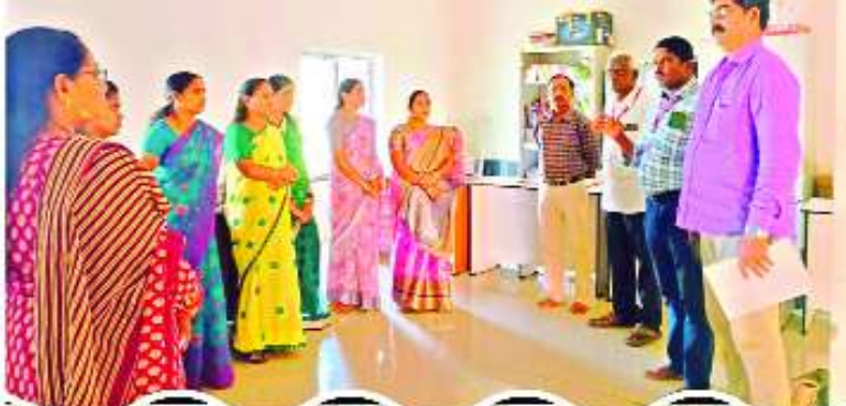
గరుగుబిల్లి, ఫిబ్రవరి 4, మేజర్ స్టాన్ :