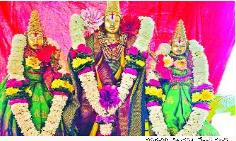
గరుగుబిల్లి, ఫిబ్రవరి 4, మేజర్ స్టాన్ :