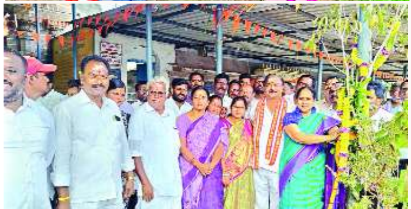
నెల్లిమర్ల, ఫిబ్రవరి 4, మేజర్ స్టూన్స్:

ప్రతిపంచాయతీలో జూన్ నాటికి 25 ఫారం పాండ్స్ ఏర్పాటు చేయాలని ద్వయా పీడి కారదాదేవి కోరారు.నెల్లిమర్ల మండలం జగ్గరాజుపేటలో ఉపాధిహామీ పథకం నిధులతో నిర్మాణం చేపట్టిన గోకులం షెడ్, ఎలీ అగ్రహారంలో ఫారం పాండ్ మంగళవారం పరిశీలించారు. క్షేత్రసహాయకులు విధిగా గ్రామాల్లో ఫారం పాండ్స్, ఫిబ్ పాండ్ లు, గోకులం షెడ్లు ఖచ్చితంగా ఏర్పాటు చేయాలని ఆదేశించారు. ఉపాధిహామీ పనులు పారదర్శకంగా చేయాలని సూచించారు. పనులు నాణ్యతగా చేపట్టాలని వెల్లడించారు. కార్యక్రమంలో ఎపిడి అరుణ తదితరులు పాల్గొన్నారు.