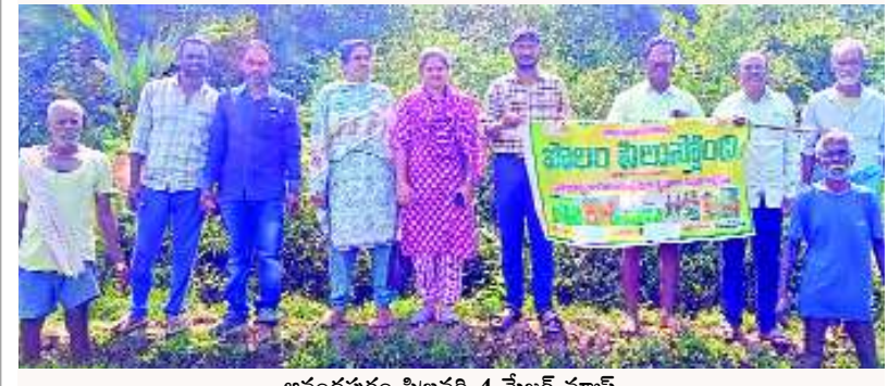
ఆనందపురం, ఫిబ్రవరి 4