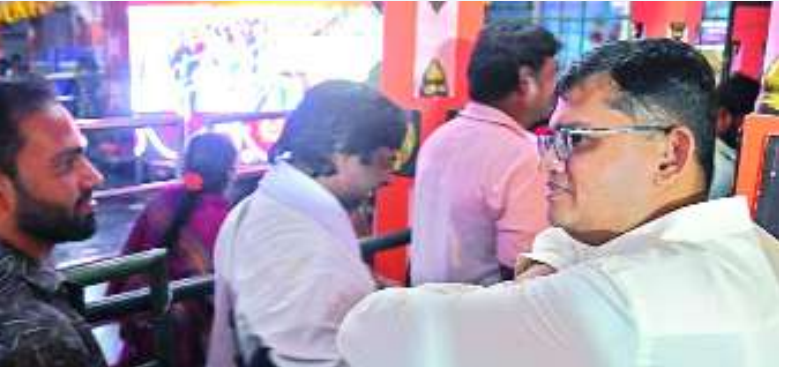
శ్రీకాకుళం ఫిబ్రవరి 4 మేజర్ స్టూన్స్ :