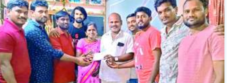
మునగపాక ఫిబ్రవరి 4 మేజర్ స్టూన్స్