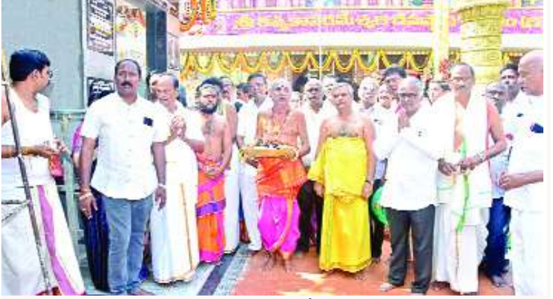
అనకాపల్లి, ఫిబ్రవరి 04, మేజర్ స్టూన్స్: