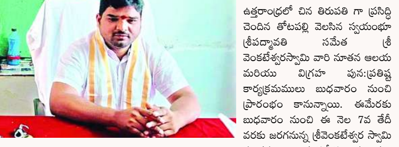
ఉత్తరాంధ్రలో చిన తిరుపతి గా ప్రసిద్ధి చెందిన తోటపల్లి వెలసిన స్వయంభూ శ్రీవెంకటేశ్వరస్వామి నమేత శ్రీ వెంకటేశ్వరస్వామి వారి నూతన ఆలయ మరియు విగ్రహ పున:ప్రతిష్ఠ కార్యక్రమములు బుధవారం నుంచి ప్రారంభం కానున్నాయి. ఈమేరకు బుధవారం నుంచి ఈ వెల 7వ తేదీ వరకు జరగనున్న శ్రీవెంకటేశ్వర స్వామి నూతన ఆలయ% శ్రీవెంకటేశ్వర స్వామి నూతన ఆలయ% మరియు,