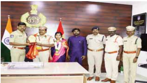
-పదవి విరమణ పొందిన ఎస్ఐ