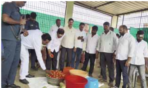
తెలంగాణ గిరిజన సంక్షేమ రెసిడెన్షియల్ పాఠశాలను