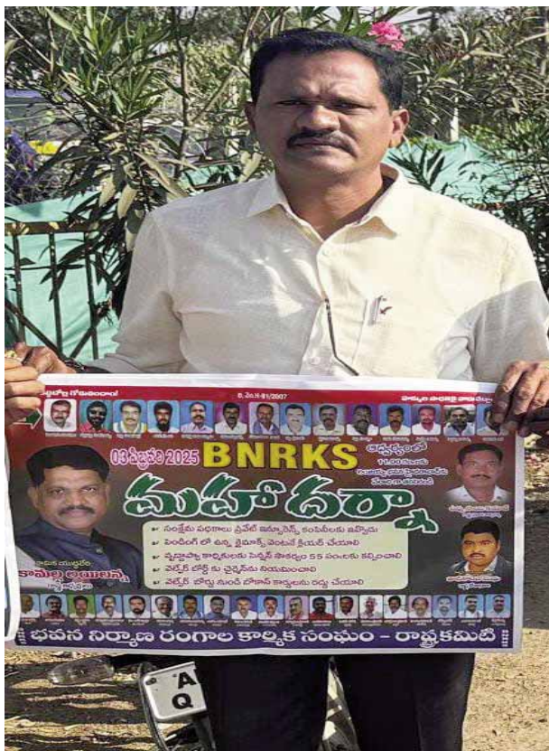
రాష్ట్ర ప్రచార కార్యదర్శి, వరంగల్