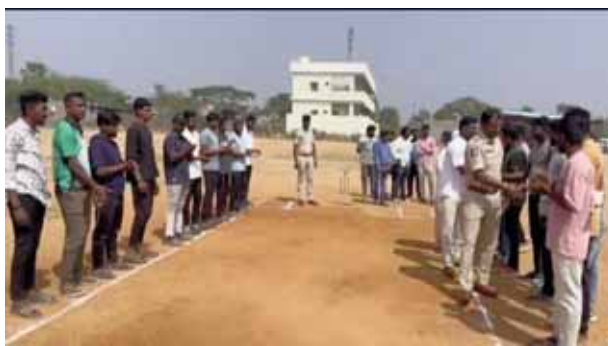
గ్రామీణ స్థాయి క్రికెట్ పోటీలను