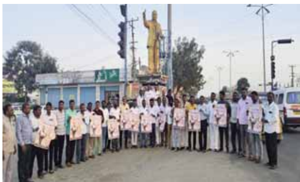
పోస్టర్ ఆవిష్కరించిన, ఎమ్మార్పీఎస్, ఎం ఈ ఎఫ్ సంఘాల నాయకులు