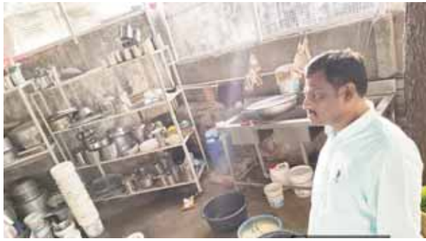
అపరిశుభ్ర హోటళ్లకు జరిమానాలు