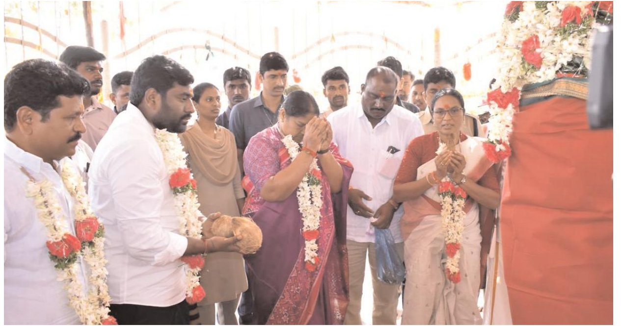
రెండు రోజుల పాటు సాగే తెలంగాణ కుంభ మేళ మినీ జాతరకు భక్తులు పెద్ద ఎత్తున తరలి వచ్చే అవకాశం ఉంటుంది కాబట్టి భక్తులకు ఇబ్బందులు లేకుండా బస్ సౌకర్యం,