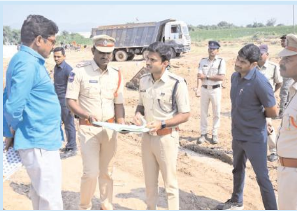
ఇసుక అక్రమ రవాణా నియంత్రణకు పకడ్బందీ చర్యలు చేపట్టాలి ములుగు ఎస్పి డా. శబరీష్. పి ఐపీఎస్