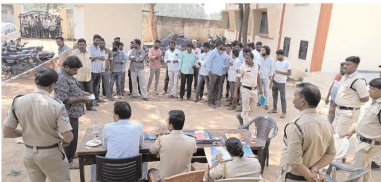
ఎక్సైజ్ సీబి ఎన్ బక్షపతి

గుడూరు ఫిబ్రవరి 13 మేజర్ న్యూస్ (సూర్య): వాహనాల వేలం ద్వారా ప్రభుత్వానికి 4,24,104 రూపాయల ఆదాయం వచ్చిందని గూడూరు ఎక్సైజ్