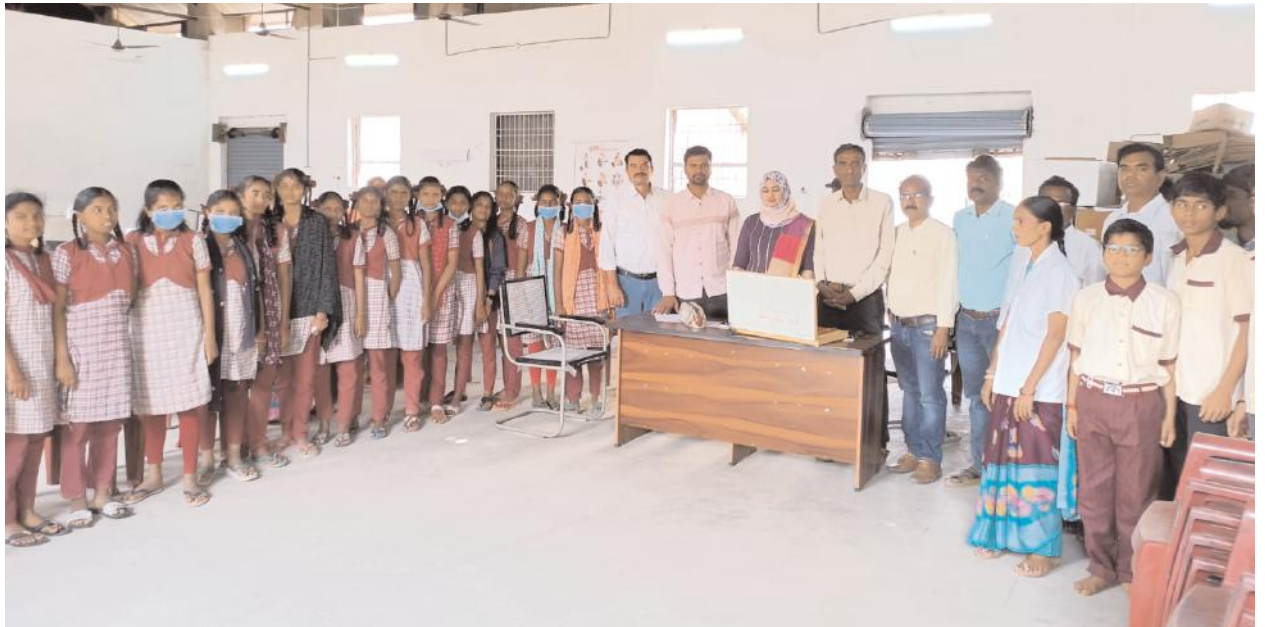
స్కీనింగ్ నిర్వహించాలని వైద్యాధికారులకు సూచించారు. మొదటి రెండు దఫాలలో ప్రభుత్వ, ఆశ్రమ పాఠశాలలు, బీసీ, ఎస్సీ, ట్రైబల్, మైనార్టీ వెల్ఫేర్, కస్తూరిబా గాంధీ బాలిక పాఠశాలలో కంటి సమస్యలపై స్కీనింగ్ నిర్వహించి 1427 మంది పిల్లలకు కంటి సమస్యలు ఉన్నట్లు గుర్తించామన్నారు. ఆర్పిఎస్సీ వాహనాల ద్వారా స్కూలు విద్యార్థులను జిల్లా కేంద్రంలోని వైద్య ఆరోగ్యశాఖ కార్యాలయానికి తీసుకువచ్చి రి - స్కీనింగ్