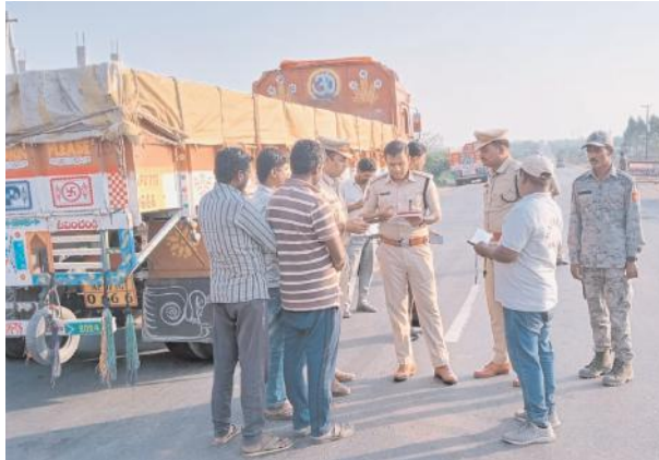
క్రిమినల్ కేసులు నమోదు చేయడం జరుగుతుందని ఎస్పీ హెచ్చరించారు. ప్రభుత్వ నిబంధనల మేరకు నిర్దేశించిన ప్రాంతంలోనే రాయల్తీ రుసుము చెల్లించి ఇసుక తవ్వకాలు చేపట్టాలని, తెలిపారు. అక్రమాలకు పాల్పడే వారు ఎంతటి వారైనా ఉపేక్షించేది లేదని చట్ట పరంగాచర్యలు తీసుకుంటామని ఎస్పీ కిరణ్ ఖరే హెచ్చరించారు.

భూపాలపల్లి సూర్య ప్రతినిధి ఫిబ్రవరి 17 మేజర్ న్యూస్: ఇసుక అక్రమ రవాణా నియంత్రణకు పకడ్బందీ చర్యలు చేపట్టాలని జయశంకర్ భూపాల పల్లి జిల్లా ఎస్పీ కిరణ్ ఖరే అన్నారు. సోమవారం మహాదేవ్ పూర్ మండలం బొమ్మాపూర్ ఇసుక క్వారీలో పాటు కాటారం మండలం మద్దులపల్లి చెక్ పోస్ట్ ను ఎస్పీ ఆకస్మిక తనిఖీ చేశారు. ఈ సందర్భంగా క్వారీలో ఇసుక నిల్వలపై ఆరా తీసి, క్వారీ ఆఫీసులో ఉన్న రికార్డులను పరిశీలించినారు. క్వారీలో ఎటువంటి అక్రమాలకు పాల్పడినా, జీరో బిల్లులు, డబుల్ ట్రిప్, అదనపు లోడ్, నకిలీ బిల్లులు, తప్పుడు వాహనంలో రవాణా, తప్పుడు గమ్యం స్థానం లాంటి ఉల్లంఘన లకు పాల్పడితే కఠిన చర్యలు తీసుకుంటామని హెచ్చరించారు. జిల్లాలో అనుమతి లేకుండా ఇసుకను తరలించడం, అక్రమంగా నిల్వ చేయడం వంటి కార్యకలాపాలను నిరోధించేందుకు పోలీసు శాఖ ప్రత్యేక దాడులు నిర్వహిస్తోందని, ఇప్పటికే అనేక ప్రాంతాల్లో దాడులు చేసి, నిబంధనలను ఉల్లంఘించిన వారిపై కేసులు నమోదు చేసినట్లు ఎస్పీ తెలిపారు. ఇసుక అక్రమ రవాణా చేసేవారిపై ప్రివెన్షన్ ఆఫ్ డ్యామేజ్ టు పబ్లిక్ ప్రాపర్టీ టిడిపి చట్టం, మైన్స్ అండ్ మినరల్స్ చట్టం ప్రకారం