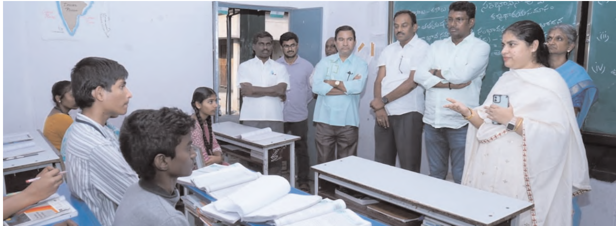
జిల్లా కలెక్టర్ డాక్టర్ సత్య శారద