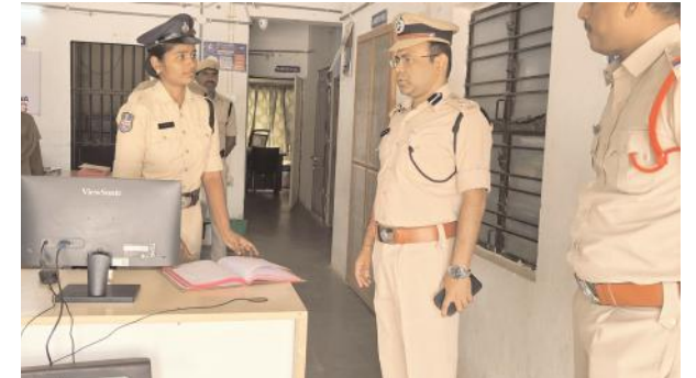
కమలాపూర్, ఫిబ్రవరి 19, మేజర్ న్యూస్ సూర్య: కమలాపూర్ పోలీస్ స్టేషన్ ను వరంగల్ పోలీస్ కమిషనర్ అంబర్ కిషోర్ రూూ బుధవారం ఆకస్మిక తనిఖీ చేశారు. ఈ సందర్భంగా స్టేషన్ పరిసరాలతో పాటు సిబ్బంది

,ఇన్స్ పెక్టర్ కార్యాలయాలను పరిశీలించారు. అనంతరం పోలీస్ స్టేషన్ రిసెప్షన్ సిబ్బంది పనితీరు పోలీస్ స్టేషన్ పెండింగ్ కేసులపై సీపీ ఆర్ తీయడంతో పాటు నేరాల నియంత్రణ కు తీసుకుంటున్న చర్యలను ఇన్స్ పెక్టర్ హరికృష్ణ ని అడిగి తెలుసు కున్నారు.