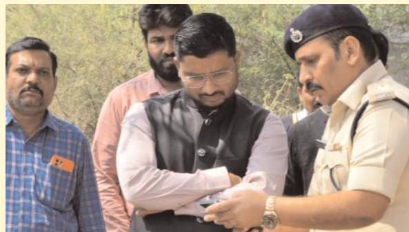
ఇసుక అక్రమ రవాణా చేస్తే కఠిన చర్యలు