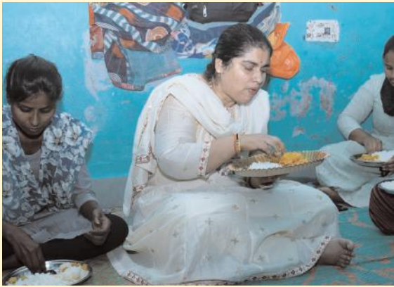
ఎస్సీ హాస్టల్లో కలెక్టర్ ఆకస్మిక తనిఖీలు నిర్వహణలో నిర్లక్ష్యంపై విచారణ చేసి నివేదిక సమర్పించాలని డిఎస్సీడిఓ కు ఆదేశాలు జారీ