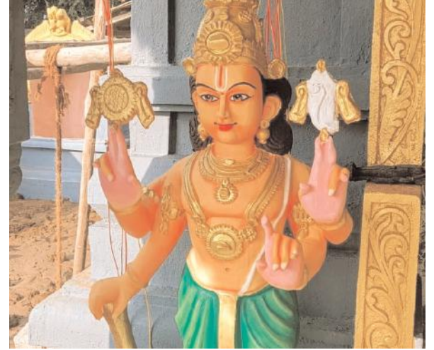
కార్యక్రమాలు నిర్వహించేందుకు గ్రామస్థులు స్వచ్ఛందంగా ముందుకు వస్తున్నారు.

ఈనెల 14 నుండి 18 వరకు ప్రతిష్ఠాపన కార్యక్రమాలు ఆలయ ప్రారంభోత్సవం అనంతరం గ్రామ దేవతల ప్రతిష్ఠాపన గ్రామస్థుల ఆధ్వర్యంలో కొనసాగుతున్న భారీ ఏర్పాట్లు