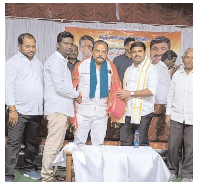
కార్యకర్తలకు దిశా నిర్దేశం చేశారు.