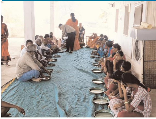
కంటి సమస్యతో ఇబ్బంది పడొద్దు అనే ఉద్దేశంతోనే ప్రతినెల సాయిబాబా