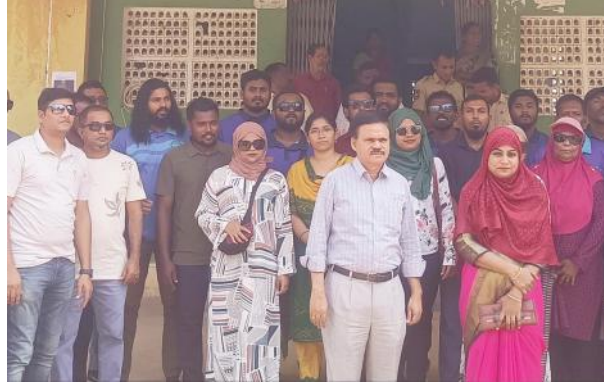
భీమదేవరపల్లి, ఫిబ్రవరి 20(మేజర్ న్యూస్ సూర్య): హనుమకొండ జిల్లా భీమదేవరపల్లి మండలంలో మాల్దీవుల బృందం పర్యటన మూడవరోజు