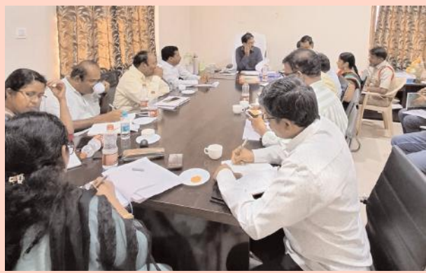
ఎన్నికల ప్రవర్తన నియమావళి నిబంధనలను పకడ్బందీగా అమలు చేయాలి