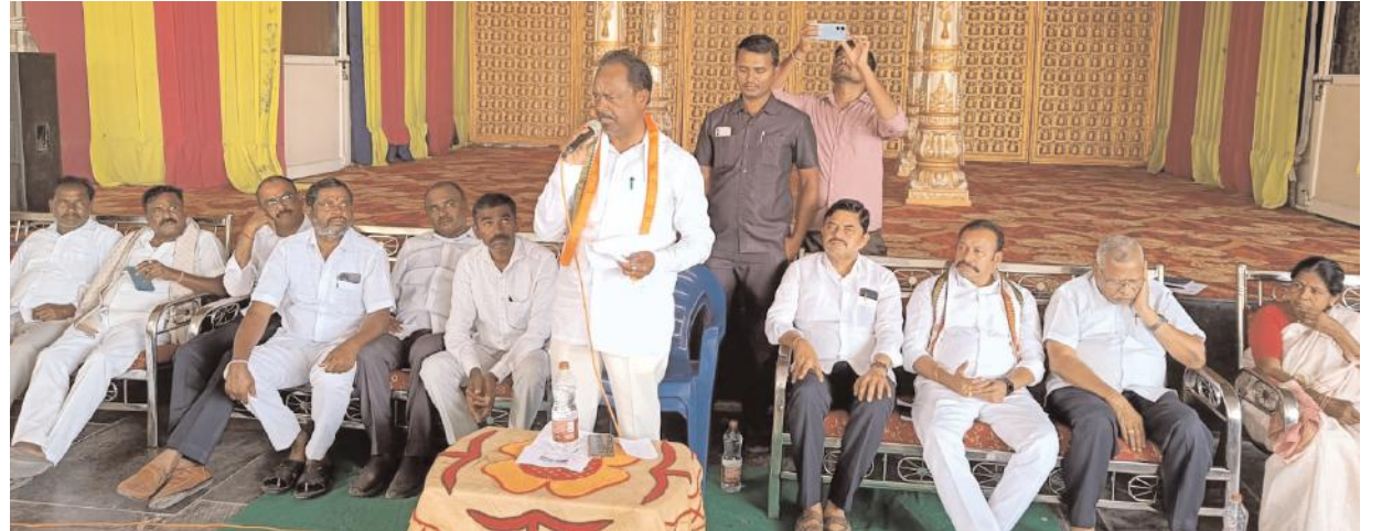
నాయకత్వంలో కొత్త, పాత అని తేడా లేకుండా పని చేయాలి