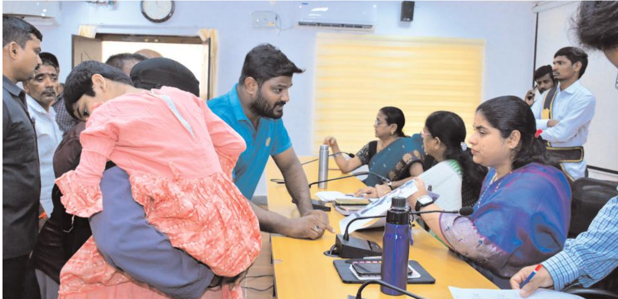
దివ్యాంగులకు ప్రతి నెల నాలుగవ శనివారం ప్రత్యేక ప్రజావాణి కార్యక్రమం జిల్లా కలెక్టర్ డాక్టర్ సత్య శారద

వరంగల్ టౌన్, ఫిబ్రవరి 22, మేజర్ న్యూస్ సూర్య: దివ్యాంగులకు ప్రతినెల