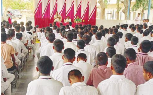
జిల్లా కలెక్టర్ డాక్టర్ సత్య శారద మండలాల్లోని 45 ప్రభుత్వ రెసిడెన్షియల్ పాఠశాలల్లో స్ఫూర్తి కార్యక్రమం నిర్వహణ.

వరంగల్ ప్రతినిధి ఫిబ్రవరి 22 మేజర్ న్యూస్ (సూర్య) విద్యార్థుల్లో జీవన నైపుణ్యాలు పెంపొందించేందుకు జిల్లా కలెక్టర్ డాక్టర్ సత్య శారద ఆలోచనల మేరకు విస్తృతంగా రాష్ట్రంలోనే మొట్టమొదటిసారిగా వరంగల్ జిల్లాలో ఫిబ్రవరి 8వ తేదీన స్ఫూర్తి కార్యక్రమాన్ని శ్రీకారం చుట్టడం జరిగింది. ప్రతి శనివారం ఒక మండలంలో ఈ కార్యక్రమాన్ని చేపట్టి దశలవారీగా జిల్లాలోని 11 మండలాల్లో పూర్తి చేయనున్నారు. ఫిబ్రవరి 8వ తేదీన వరంగల్ జిల్లా ఖానాపూర్ మండలంలోని 14 ప్రభుత్వ వసతి గృహాల్లో పూర్తి స్థాయి లో కార్యక్రమాన్ని చేపట్టడం జరిగిందని తెలిపారు. ఫిబ్రవరి 15 వ తేదీన రాయపర్తి మండలంలోని 15 ప్రభుత్వ పాఠశాలలు వసతి గృహాల లో 6