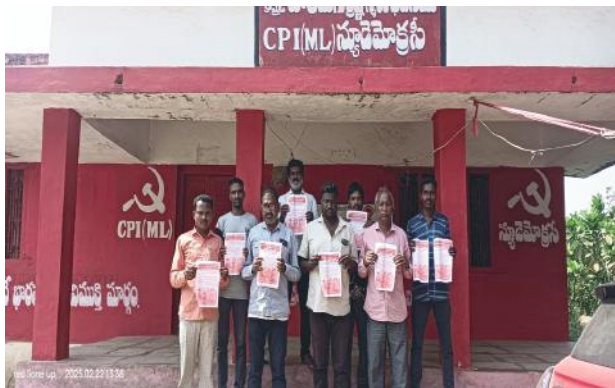
యానిట్ల టెండర్లు వెంటనే వేయించాలి సకాలంలో పూనింగ్ పనులు చేపట్టాలి