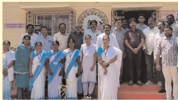
ప్రజలకు నాణ్యతతో కూడిన