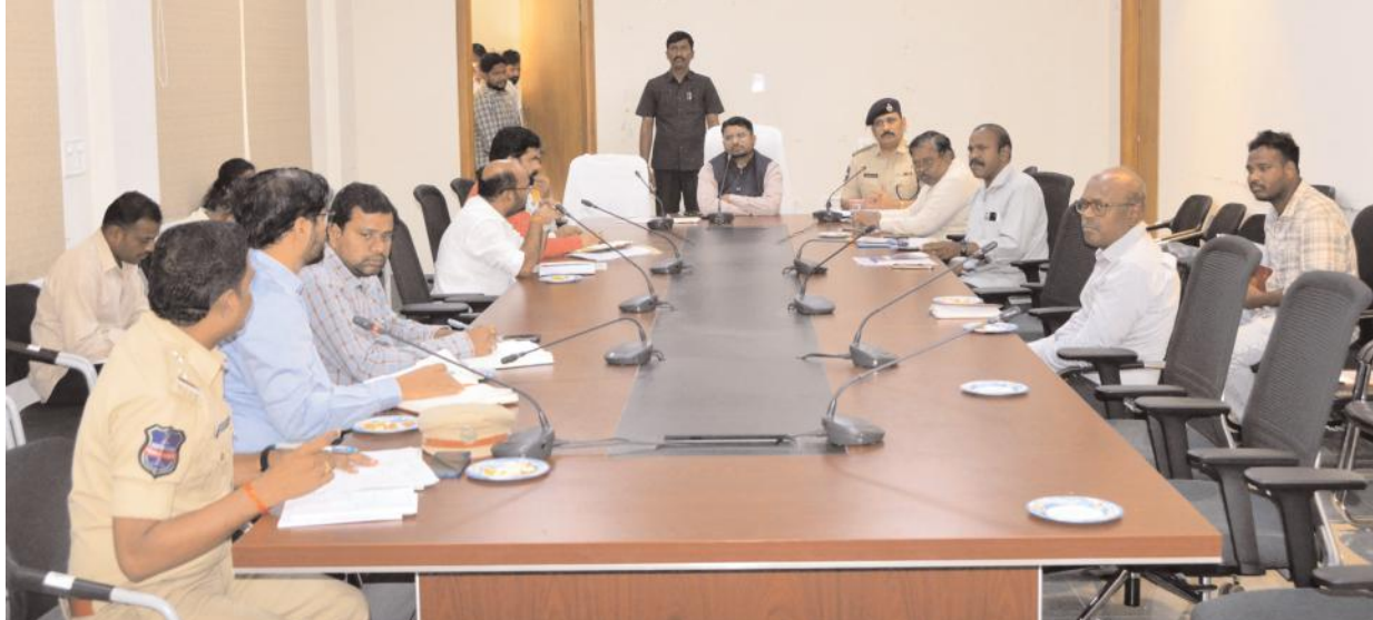
పాఠశాలలు, కళాశాలల్లో ప్రతి శుక్రవారం నిర్వహిస్తున్న బ్యాగ్ డే ను సమర్థవంతంగా నిర్వహించాలని, రైల్వే స్టేషన్, ఆర్టీసీ బస్టాండ్ పరిధిలో ప్రతి పదిహేను రోజులకోసారి విస్తృత ప్రచార కార్యక్రమాలు చేపట్టి అవగాహన కల్పించాలని తెలిపారు. ఇలాంటి అవగాహన కార్యక్రమాల ఏర్పాటుతో సమాజంలో మార్పు తీసుకు రావచ్చన్నారు. మత్తు పదార్థాల రవాణాపై ప్రత్యేక నిఘా పెట్టాలని, తనిఖీలు నిర్వహించాలన్నారు. యువత మత్తుకు బానిస కావద్దని, ఉజ్వల భవిష్యత్తును నాశనం చేసుకోవద్దని తెలిపారు. జిల్లాలో ఎక్కడైనా మాదకద్రవ్యాల అక్రమ రవాణా, విక్రయాలకు

జనగామ అర్చన్, ఫిబ్రవరి 25, మేజర్ న్యూస్ సూర్య: మత్తు పదార్థాల నియంత్రణకు కట్టుదిట్టమైన చర్యలు చేపట్టాలని జిల్లా కలెక్టర్ రిజ్వాన్ బాషా షేక్ అధికారులను ఆదేశించారు. మంగళవారం జిల్లా సమీకృత కలెక్టర్ కార్యాలయంలోని మినీ కాన్ఫరెన్స్ హాల్లో డీసీపీ రాజు మహేంద్ర నాయక్ తో కలిసి జిల్లా కలెక్టర్ రిజ్వాన్ బాషా షేక్ మత్తు పదార్థాల నియంత్రణపై విద్యా, వ్యవసాయ, ఎన్ఫోర్స్, పోలీసు, వైద్య శాఖ అధికారులతో సమీక్ష సమావేశాన్ని నిర్వహించారు. ఈ సందర్భంగా జిల్లా కలెక్టర్ మాట్లాడుతూ