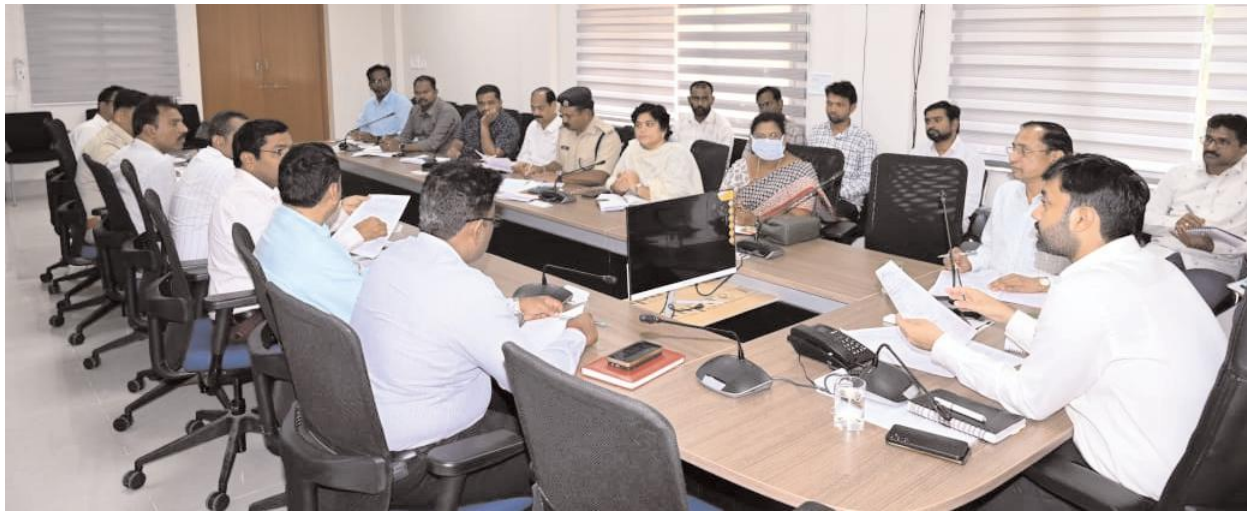
జిల్లా ఎన్నికల అధికారి