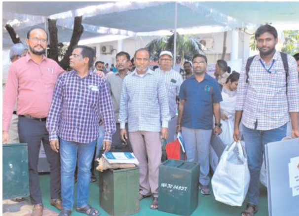
మొదటి పేజీ తరువాయి..

పోలింగ్ కేంద్రాలకు ఎన్నికల సిబ్బంది పోలింగ్ సామాగ్రితో సహా బుధవారం సాయంత్రానికి చేరుకున్నారు