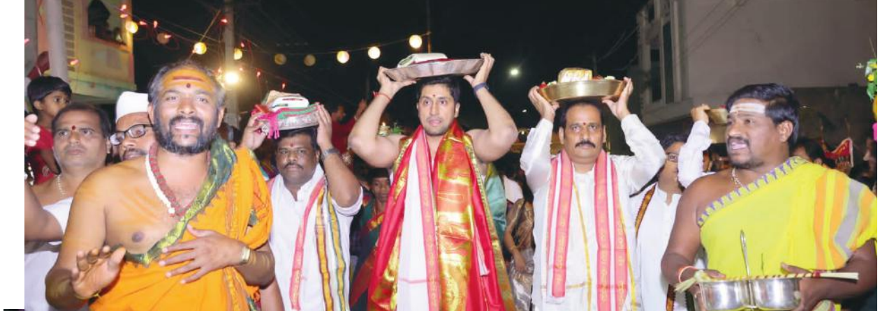
భక్తులతో కిటికిలాడిన ఆలయం