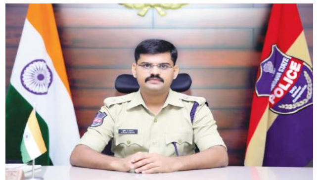
తిరగవద్దని,పార్టీ జెండాలు పార్టీ గుర్తులు ప్లే కార్డ్స్ ధరించవద్దు, ప్రదర్శించ వద్దన్నారు.మైకులు, లాడ్ స్పీకర్లు వాడరాదు, పాటలు ఉపన్యాసాలు ఇవ్వకూడదన్నారు.మొబైల్ ఫోన్స్, ఎలక్ట్రానిక్ వస్తువులు పోలింగ్ కేంద్రంలోకి అనుమతి లేదని, ధర్మాలు, రాస్ట్రాకోళ్లు, ఊరేగింపులు, టపాకాయలు కాల్యడం లాంటివి నిర్వహించడం నేరంగా పరిగణించడంతో పాటు సదరు వ్యక్తుల పై చట్టపరమైన చర్యలు తీసుకోవడం జరుగుతుందన్నారు.ఓటు హక్కు కలిగిన పట్టభద్రులు, ఉపాధ్యాయులు, పోలీసుల సలహాలు సూచనలు పాటించి ఎమ్మెల్సీ ఎన్నికలు ప్రశాంతంగా నిర్వహించడానికి సహకరించాలని సూచించారు.