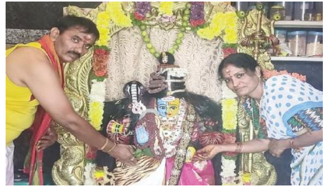
అయ్యారని తెలిపారు. మహా శివరాత్రి సందర్భంగా నగర ప్రజలకు భక్తులకు ఆలయ కార్యనిర్వాహన సమితి తరుపున శుభాకాంక్షలు తెలియ జేశారు.

మహాబాబాబాద్ జిల్లా ప్రతినిధి, ఫిబ్రవరి 26,మేజర్ న్యూస్ (సూర్య ):ఉపాధ్యాయ,పట్టభద్రుల ఎన్నికల సందర్భంగా 150 మంది పోలీస్ సిబ్బందితో పటిష్ట బందోబస్తు ఏర్పాటు చేయడం జరిగిందని,ప్రశాంత వాతావరణంలో ఎన్నికల నిర్వహణకు అధికారులు, సిబ్బంది కృషి చేయాలని ఎన్నికల విధులు నిర్వహించే అధికారులకు,సిబ్బందికి జిల్లా ఎస్పీసుధీర్ రానాథ్ కేకన్ సూచించారు. ఈ సందర్భంగా ఎస్పీ మాట్లాడుతూ ఎమ్మెల్సీ ఎన్నికల సందర్భంగా జిల్లాలో ఏర్పాటు చేసిన 16 పోలింగ్ కేంద్రాల్లో 1663 మంది ఓటర్లు తమ ఓటు హక్కును ప్రశాంత వాతావరణంలోవినియోగించుకునే పోలింగ్ పక్రియ మొదలు నుండి పూర్తి అయ్యేవరకు పోలింగ్ కేంద్రాల వద్ద విధులలో ఉన్న అధికారులు, సిబ్బంది అప్రమత్తంగా ఉండాలన్నారు. జిల్లాలోని పోలీస్ కేంద్రాల వద్ద అవాంఛనీయ సంఘటనలు జరగకుండా 163 బిఎన్ఎస్ ఎస్ ఆక్ట్ (144 సెక్షన్) అమలులో ఉంటుందని, 100 మీటర్ల, 200 మీటర్ల పరిధిలో ఆంక్షలు ఉంటాయని,ఎవరైనా చట్ట విరుద్ధంగా ప్రవర్తించిన, గొడవలు సృష్టించాలని చూసిన వారిపై చట్ట ప్రకారం కఠిన చర్యలు తీసుకోవడం జరుగుతుందని ఎస్పీ తెలిపారు. పోలింగ్ కేంద్రాల వద్ద 163 బిఎన్ఎస్ ఎస్ సెక్షన్ అమలులో ఉందని,బదుగురు కానీ అంతకంటే ఎక్కువమంది కానీ గుంపులు గుంపులుగా