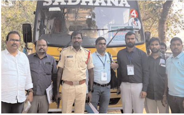
కన్నాయిగూడెంలో ప్రశాంతంగా ముగిసిన ఎమ్మెల్సీ ఎన్నికలు