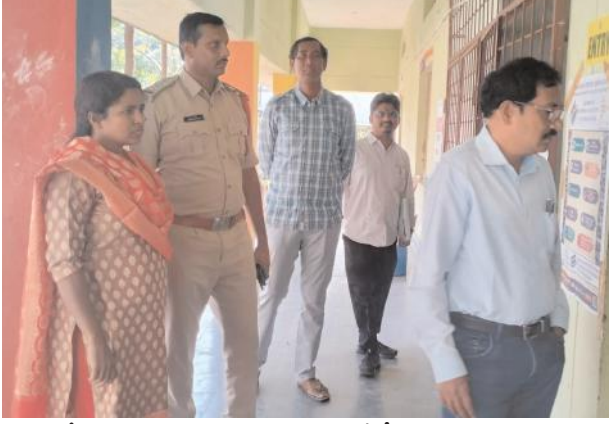
అవాంఛనీయ సంఘటనలు జరగకుండా పోలీస్ యంత్రాంగం కట్టుదిట్టమైన ఏర్పాట్లు చేసింది.